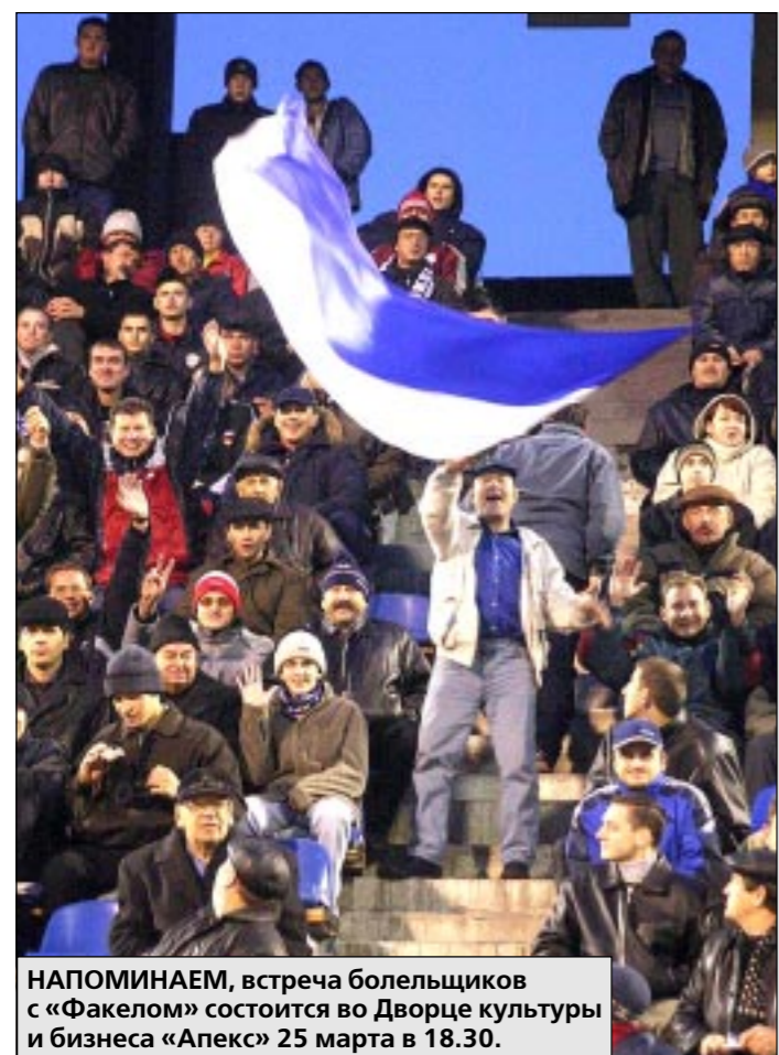
НАПОМИНАЕМ, встреча болельщиков с «Факелом» состоится во Дворце культуры и бизнеса «Апекс» 25 марта в 18.30.