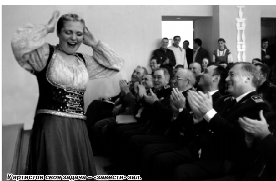
Уртистов своя задача — «завести» зал.