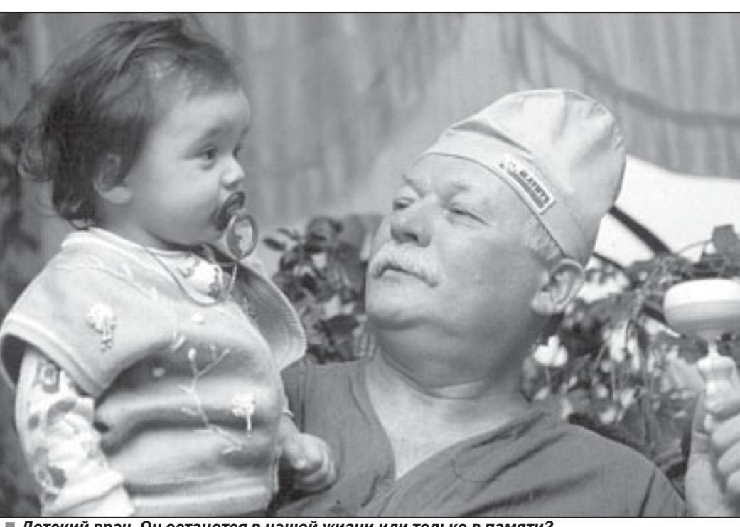
Детский врач. Он останется в нашей жизни или только в памяти?