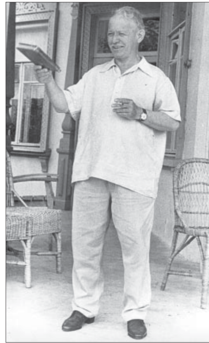
М.А.Шолохов. 1978 год, станция Вешенская.

24 мая нынешнего года исполняется 100 лет со дня рождения Михаила Шолохова. Великий русский, советский писатель начинал свою творческую деятельность на воронежской земле, когда с 1915 по 1918 год учился в гимназии Богучара. Именно здесь будущий классик мировой литературы и лауреат Нобелевской премии начал пробовать себя в литературе. Михаил Шолохов был дружен и с нашим земляком писателем Андреем Платоновым, помогал собрату по перу в трудное для него время. В преддверии столетнего юбилея Михаила Александровича Шолохова «Коммуна» намерена опубликовать ряд очерков, посвященных малоизвестным страницам жизни и творчества великого писателя. Сегодня – первый из них.