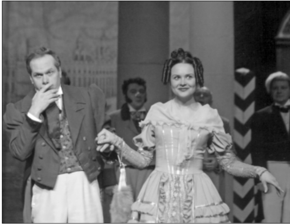
Сцены из спектакля «Ревизор».