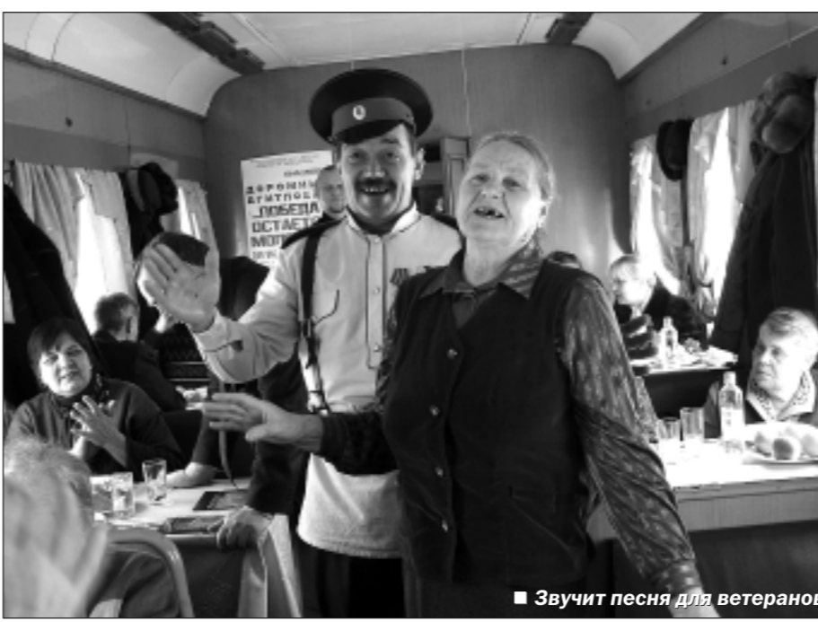
Звучит песня для ветеранов.

...В Лисках уже ждали участников агитпоезда. К назначенному времени в зале ожидания вокзала на втором этаже собрались ветераны войны и тыла. Многие из них пришли сюда с внуками и правнуками. По сути дела, это была встреча разных поколений. И зазвучали песни, стихи, воспоминания. Вокальные коллективы Дворца культуры железнодорожников «Русская песня» и «Сиреневый туман», ансамбль песни и пляски «Казачьи России» исполнили песни военных лет, звучали народные мелодии. Виртуозность, легкость и мастерство продемонстрировали перед собравшимися участники ансамбля танца «Русь». Ветераны были растроганы таким вниманием к ним, и у некоторых на глазах невольно появились слезы. А после концерта фронтовиков пригласили в вагон-ресторан. Там их ждали праздничный обед и боевые сто граммов. И снова агитпоезд отправляется в путь. В Евдаково, Сагуны, Поворино, Россошь,