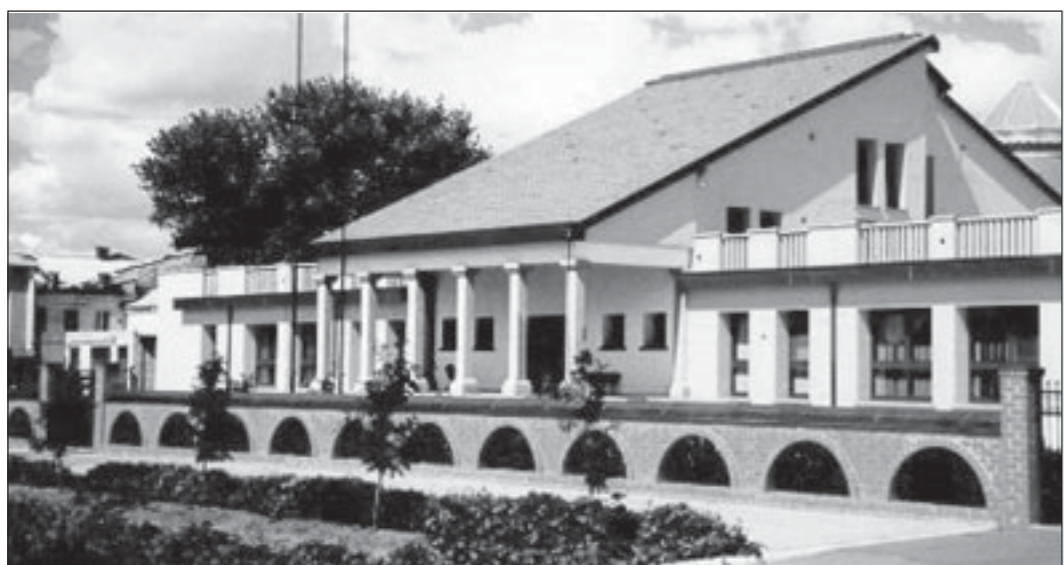
Итальянский детский сад в Россоши.

После бурных протестов населения администрация Воронежской области признала незаконным строительство венгерских и немецких мемориалов: «При возведении мемориала венгерским солдатам, погибшим здесь в 1942-1943 годах, нарушены условия межправительственного договора