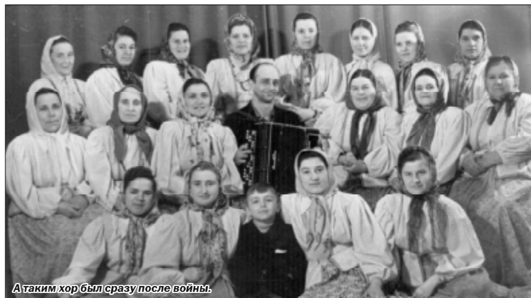
А таким хор был сразу после войны.