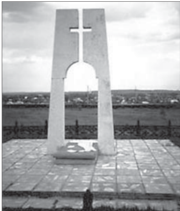
Памятник немцам в Первой Еманче Хохольского района.