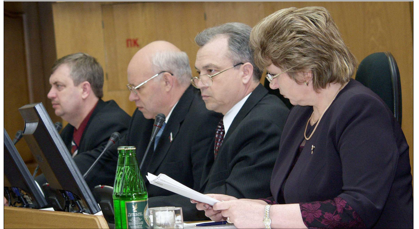
Поправки в законодательство сделали мировое правосудие доступнее для граждан

Во втором, окончательном, чтении, депутаты на 2-м заседании областной Думы приняли изменения в Закон «О мировых судьях Воронежской области». Их главная цель – сделать мировое правосудие доступнее для воронежцев. Изменения коснулись статей 9 и 10 областного Закона, регулирующих вопросы исполнения обязанностей временно отсутствующего мирового судьи.