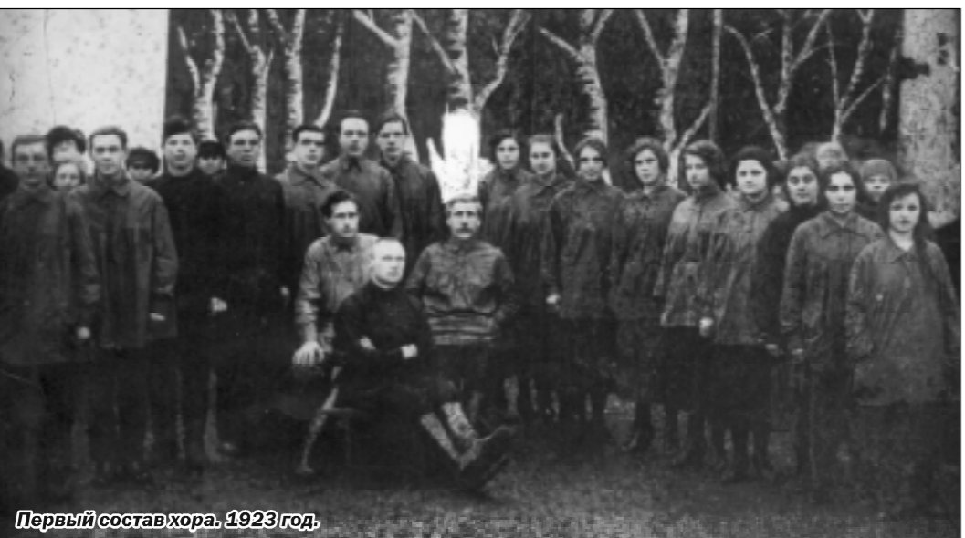
Первый состав хора. 1923 год.