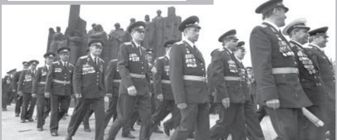
Вчера в областном Доме журналистов открылась фотовыставка «Поколение победителей». Организаторами ее выступили: редакция газеты «Коммуна» и управление по печати областной администрации. С сегодняшнего дня мы открываем новую рубрику, где будем представлять экспонаты фотовыставки.