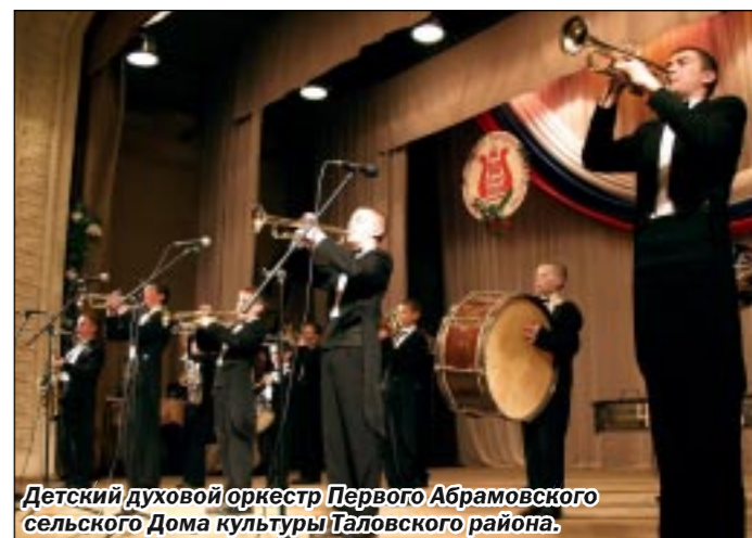
Детский духовой оркестр Первого Абрамовского сельского Дома культуры Таловского района.

Третий областной фестиваль народного творчества «Салют Победы» стартовал два года назад, в мае 2003 года. С тех пор в его рамках прошло множество разнообразнейших культурных акций. Двухлетняя фестивальная программа включала творческие отчеты культурно-досуговых учреждений, смотр конкурсов самодеятельных коллективов, фестивали военно-патриотической и солдатской песни, выставки живописи и декоративно-прикладного творчества, показы художественных и документальных фильмов, встречи с бывшими фронтовиками и труженниками тыла... Представители разных поколений, горожане и жители отдаленных сел объединились для того, чтобы поделиться с аудиторией своим творческим откликом на трагические и героические события Великой Отечественной. «Салют Победы» стал удачным примером фестиваля действительно народного. В общей сложности в его программе приняли участие более тысячи творческих коллективов и исполнителей области.