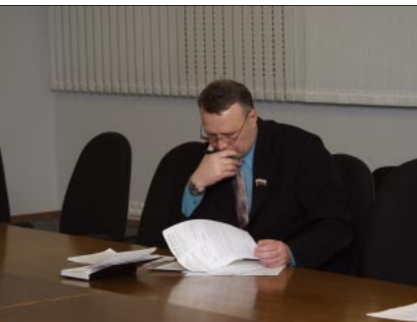
На первом заседании комитета по труду и социальной защите населения было немало поводов для глубоких раздумий и дискуссий.