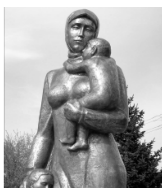
Скульптура солдатской вдовы.