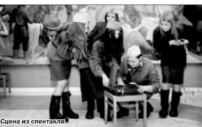
Сцена из спектакля.