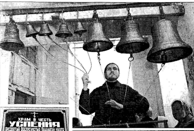
ХРАМ В ЧЕСТЬ УСПЕНИЯ ПРЕСВЯТЫХ БОГОРОДИЦЫ И ПРИСНОДЕВЫ МАРИИ