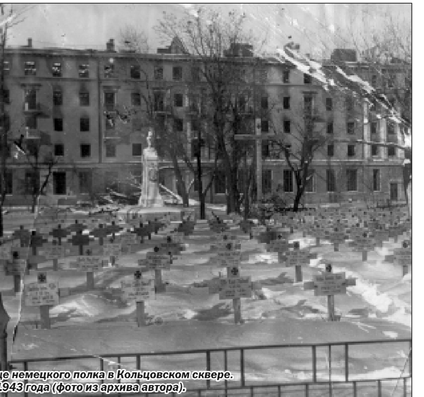
Кладбище немецкого полка в Кольцовском сквере. Январь 1943 года.

Поддерживаемый огнем батальон велосипедистов заехал неожиданно с фланга большевиков. Наши солдаты неожиданно увидели по ту сторону больницы длинные шпильные змеи огнеметов, услышали беспорядочные выстрелы и поняли, что теперь настал немецкий час для наступления на больницу. И она была взята. В некоторых палатах еще лежали больные. Не успели немцы