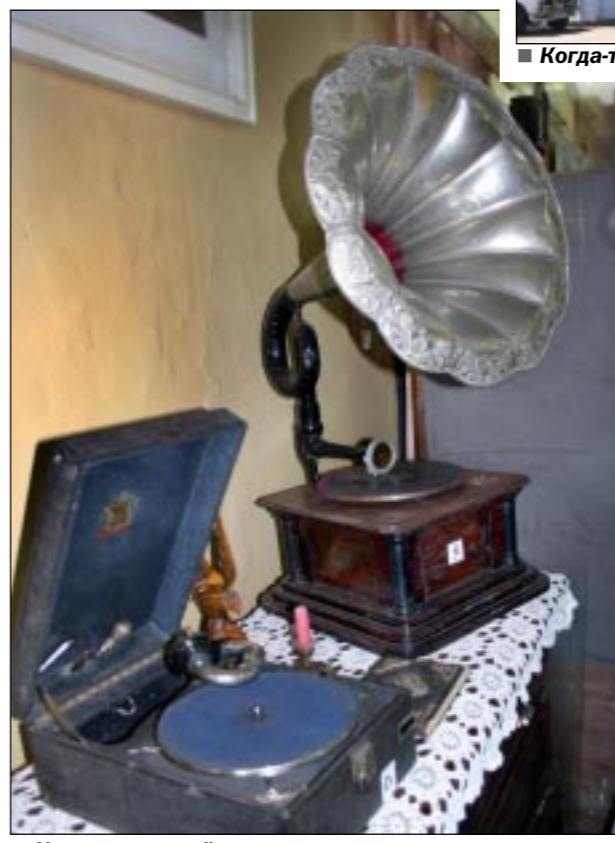
Из музыкальной коллекции.