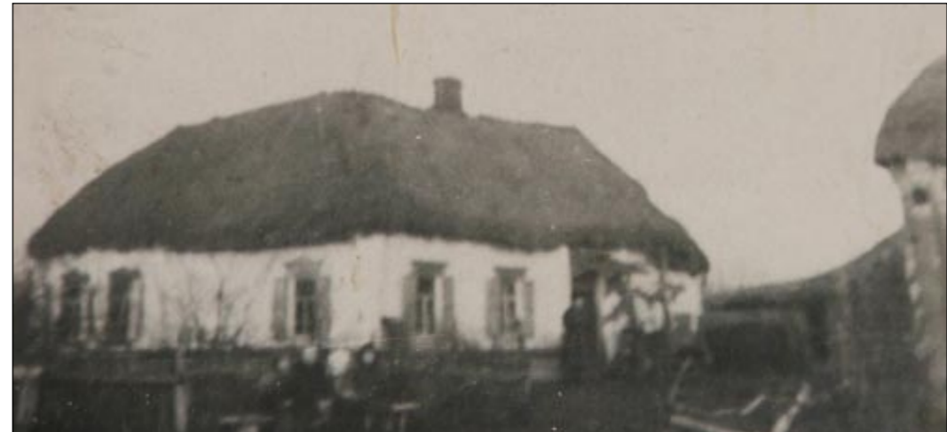
Первая хата на Высоком. 1921 год.