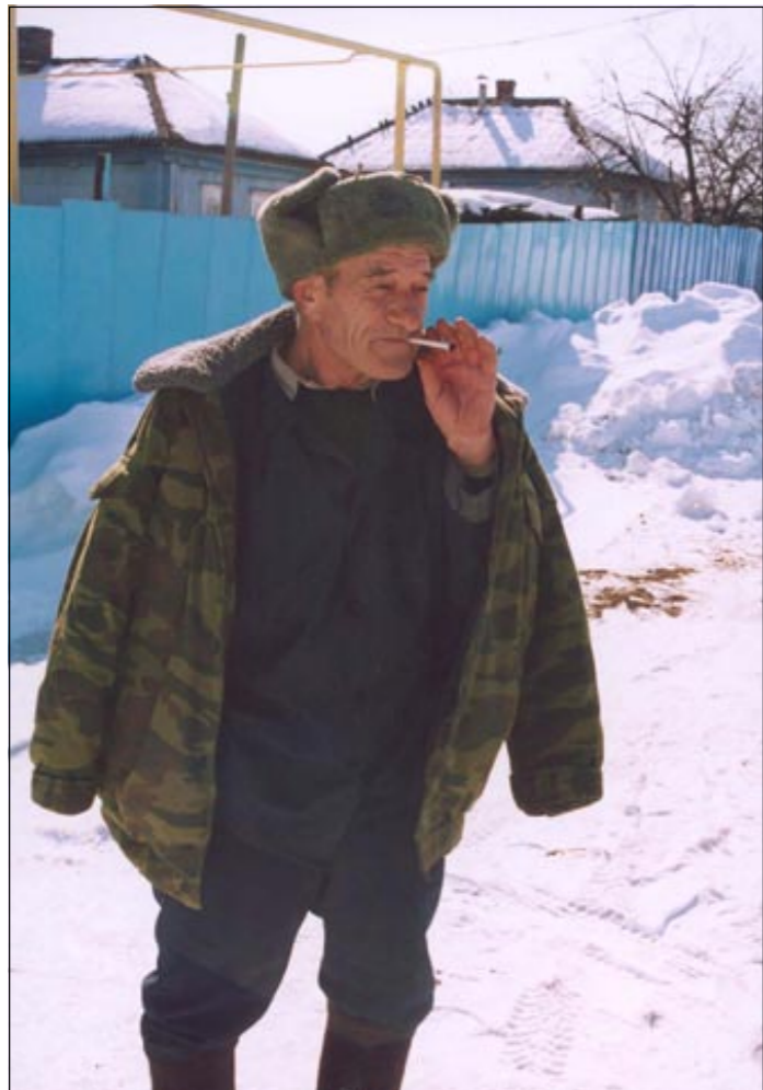
Высоко жить - далеко глядя.