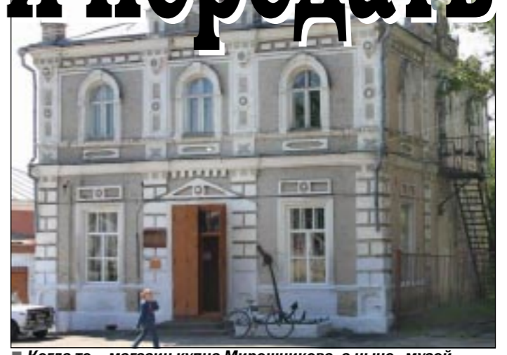
Когда-то — магазин купца Мирошникова, а ныне — музей.

Виктор СИЛИН. г.Бобров.