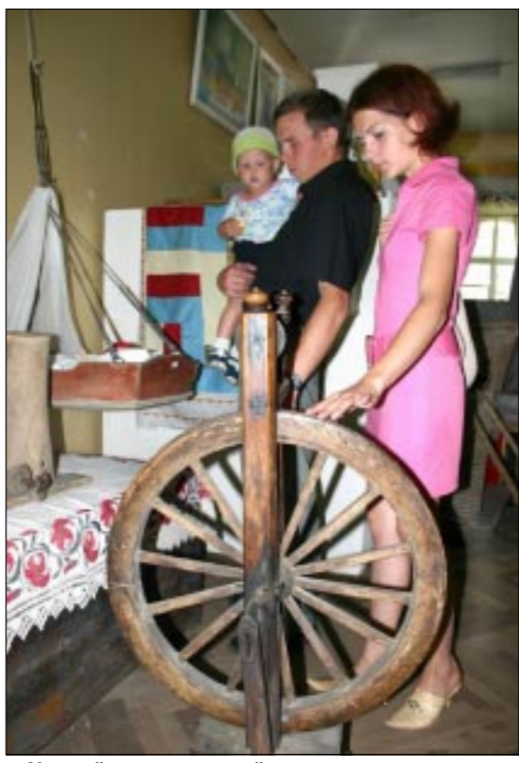
У музейных экспозиций.