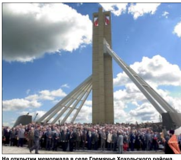
На открытии мемориала в селе Гремяче Хохольского района.