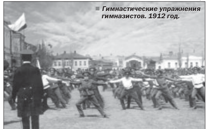
Гимназическое упражнение гимназистов. 1912 год.

гимназических порядках. Появился так называемый «старостат», который формировался из старост, выбранных в старших классах. Два его представителя вошли в состав педагогического совета. Будучи типичным помещиком (со всеми ее положительными сторонами и перегибами), среди прочего, новая организация помогала в получении бесплатных завтраков, выполняла функции товарищеского суда, рассматривая персональные проступки учащихся. Тогда же воспитанники мужской и женской гимназий организовали Союз учащихся, одним из основных деяний которого стало открытие при поддержке зажиточного отца двух гимназисток, некоего Татарничева, кинотеатра в большом зале бывшего склада. Именно здесь зажглась первая в Богучаре электрическая лампочка. Для учащихся входной билет стоил пять копеек —