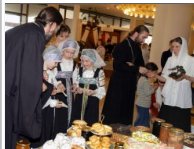
Вчера, в Неделю жен мироносиц, Воронежская и Борисоглебская епархии отметили День православной матушки.