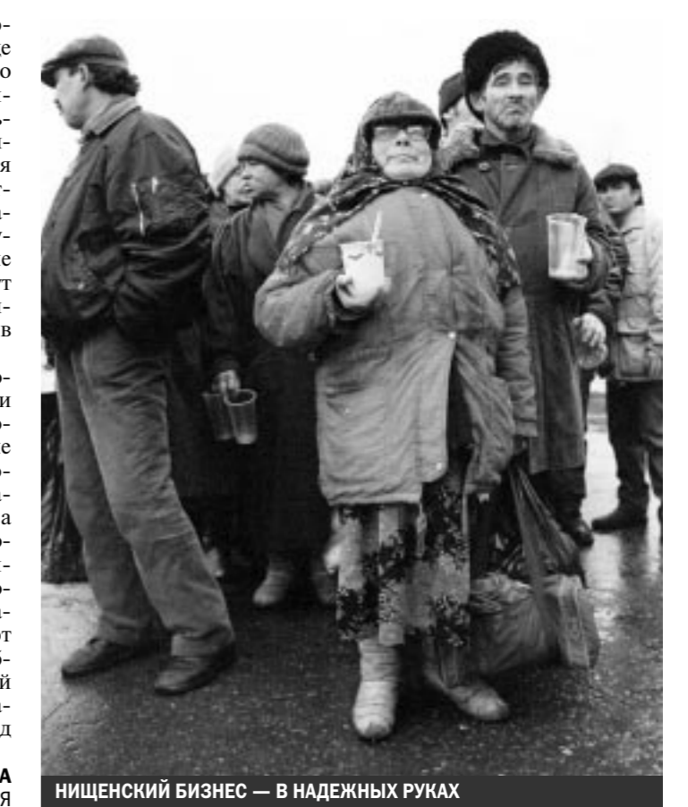
НИЩЕНСКИЙ БИЗНЕС — В НАДЕЖНЫХ РУКАХ

обладают редкостной красотой, что делает их бизнес еще доходнее. Рассказывают, что некоторые из них в «командировках» частенько обольщают пожилых мужчин с толстыми кошельками, а спустя несколько месяцев совместной жизни исчезают, прихватив значительную часть имущества супруга. А настоящие мужья в это время либо ведут хозяйство и растят детей, либо уезжают на заработки в Москву. Педагоги найманской школы говорят, что такие семьи абсолютно нормальные и социально устойчивы. В них не пьют, не курят, о детях заботятся хорошо: малышки стараются одеть с иголочки, а старшим дать высшее образование, в основном медицинское или юридическое. Молодые семьи, как правило, с самых первых дней не имеют бытовых и финансовых проблем. Дело чести родителей обеспечить их жильем, обстановкой, за которую ни перед кем «не будет стыдно».