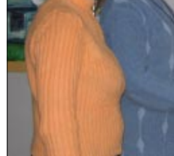
У «Мира моего детства».