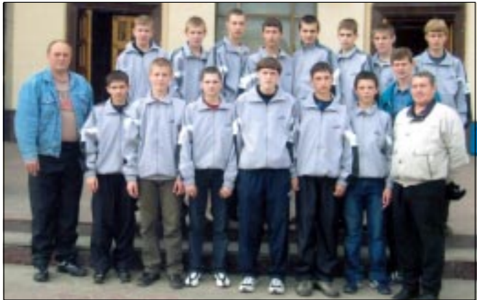
На снимке: «серебряная» дружина воронежской ДЮСШОР на зональном турнире Спартакиады ЦФО.