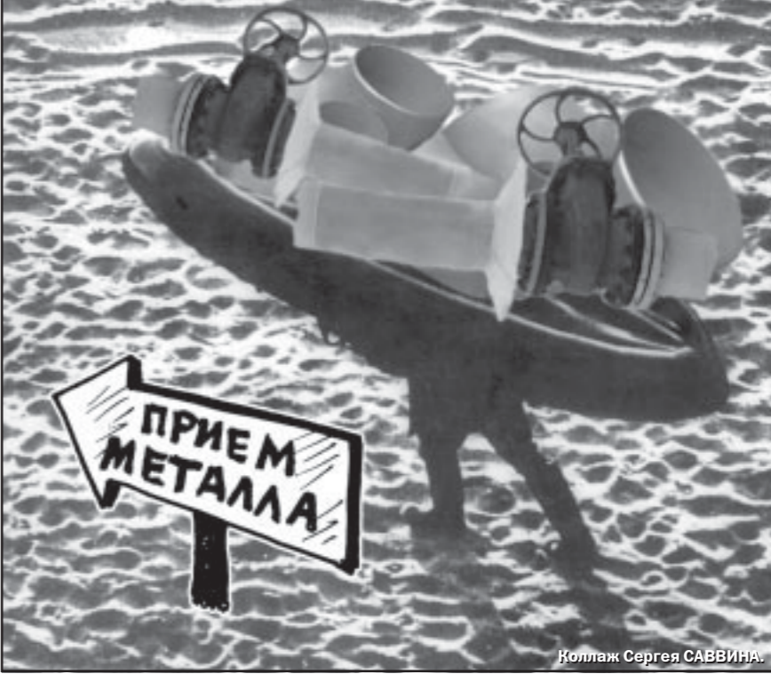
Иллюстрация Сергея САВВИНА.

А вот простая такая история, почти бытовая. Летним вечером в одном из воронежских лес паренек со своим младшим братом отправились за металлом. Мате-