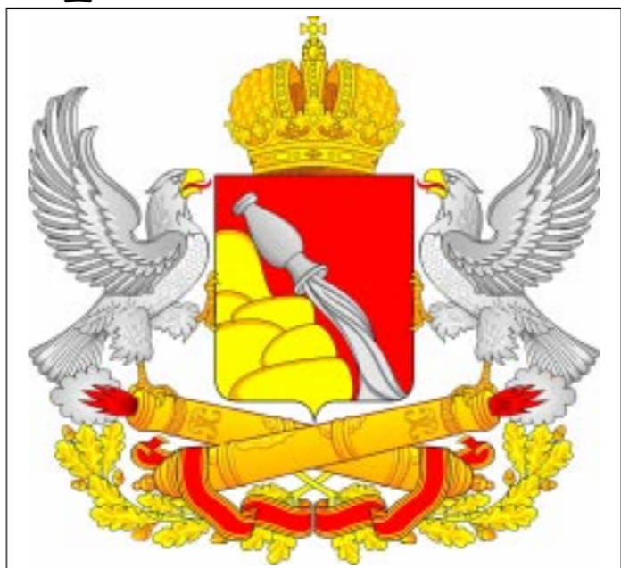
"Герб - род щита с изображением на нем знаков, присвоенных городу". Владимир Даль. Толковый словарь.

Белый цвет (серебро) в геральдике – символ благородства, чистоты, справедливости, великодушия, а также символ мира. Желтый цвет (золото) символизирует урожай, изобилие и плодородие, аллегорично показывая развитый аграрный сектор экономики области. Вместе с тем золото символизирует величие, уважение, прочность, интеллект, а также свет и духовность. Кувшин на горе, изливающий воду, – уникальный исторический символ воронежской земли – отражает богатство и плодородие. Кроме того, кувшин как творение умелых человеческих рук аллегорически показывает трудолюбие жителей области. Гора звучна с холмистым рельефом и крутыми речными берегами, на которых расположены многие города, поселки и деревни. Пшеница салютует в честь трудовых и ратных побед жителей Воронежской области, а также олицетворяет собой вклад предприятий в укрепление оборонной мощи страны. Дубовые ветви – символ мужества, силы и стойкости, проявленных жителями области в годы Великой Отечественной войны. Они соотносятся с дубовыми ветвями из исторического герба Воронежской губернии. Ветви обвиты двумя орденскими лентами, что подчеркивает большие заслуги Воронежской области, за которые она награждена орденами Ленина. Корона и орлы заимствованы из старшего воронежского герба, утвержденного в своих канонических параметрах еще в 1787 году. Депутаты Илья ЕРИХОНОВ , Александр ЛАТУШКО , Игорь МАКАРОВ , Андрей РОГАТНЕВ