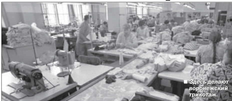
Здесь делают воронежский трикотаж.

В это воскресенье отмечается День работников текстильной и легкой промышленности. В последние годы эта отрасль переживает далеко не лучшие времена, однако немало ее предприятий смогли преодолеть трудности и найти свою нишу в современных рыночных условиях хозяйствования. В том числе и наши воронежские – «Промтекстиль», «Борисоглос-