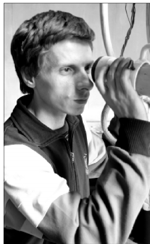
«Главный астроном» Игорь Виньяминов.