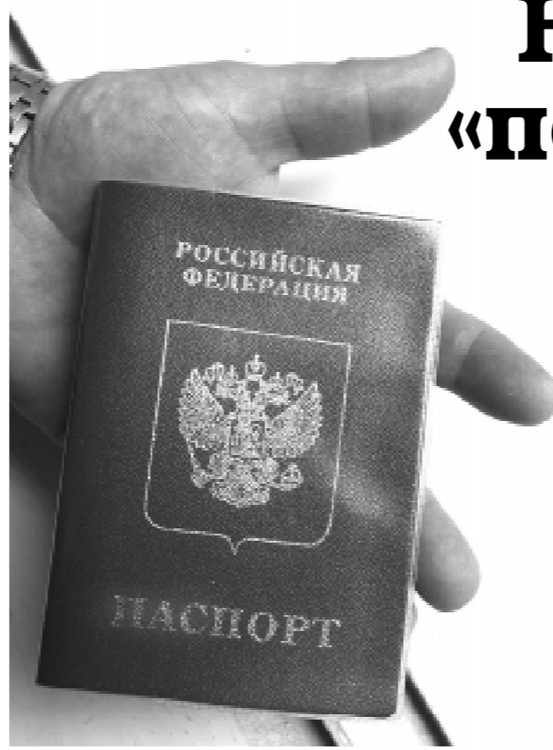
Внешне новый загранпаспорт будет отличаться от ныне действующего лишь цветом – его обложка будет не красной, а синей. Главное – содержание.

На днях чиновники паспортно-визовых служб представили новый образец российского загранпаспорта. При этом поспеши успокоить граждан: переход на новые загранпаспорта будет плавным.