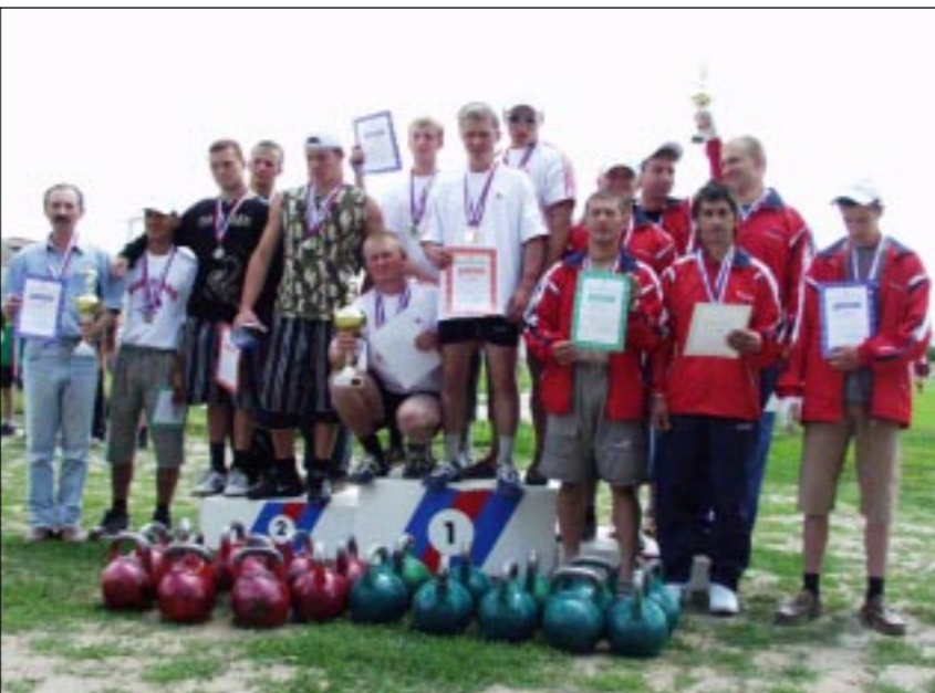
Первые медали на Сельских играх-2005 получили самые сильные люди области - гиревики.