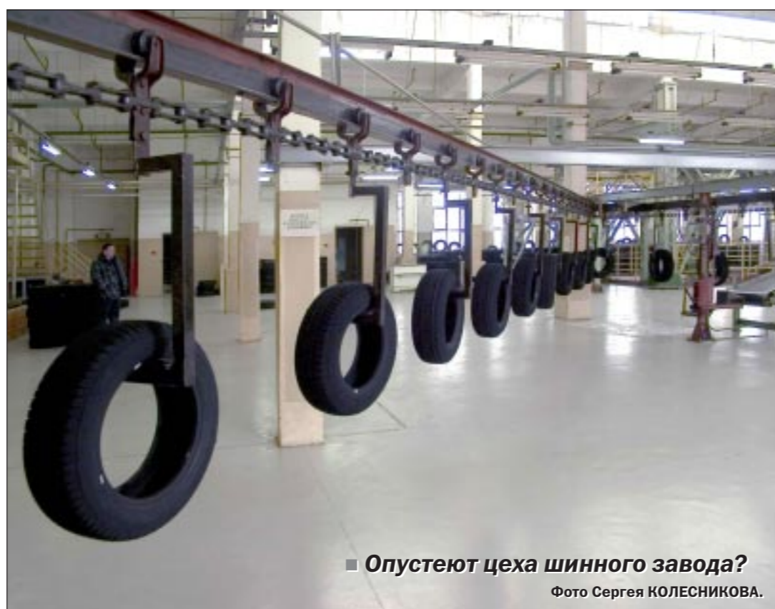
Опустеют цеха шинного завода?

Предстоящее массовое увольнение работников ООО «Амтел-Черноземье» стало темой совещания в областной администрации