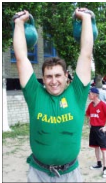
Рамонь полна решимости принять эстафету «малой воронежской олимпиады».