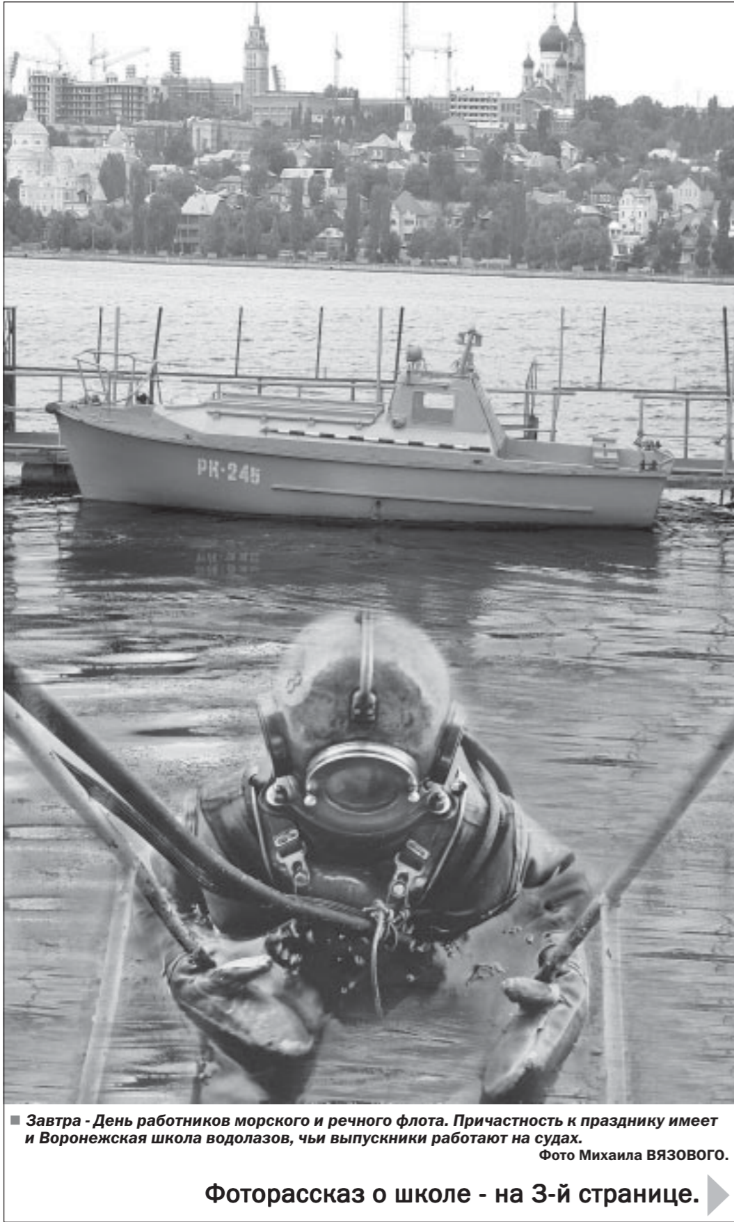
Завтра - День работников морского и речного флота. Причастность к празднику имеет и Воронежская школа водолазов, чьи выпускники работают на судах.