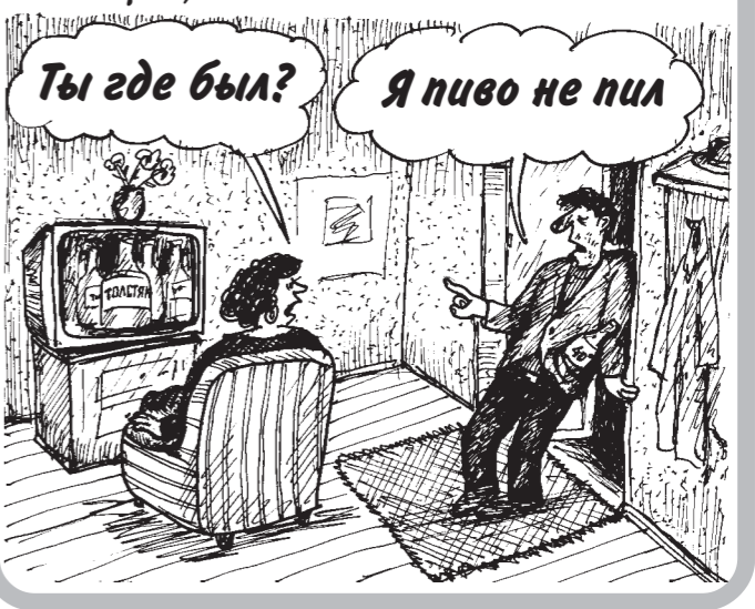
Ты где был? Я пиво не пил