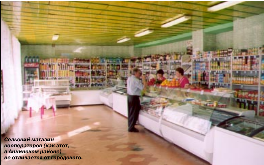
Сельский магазин кооператоров (как этот, в Аннинском районе) не отличается от городского.