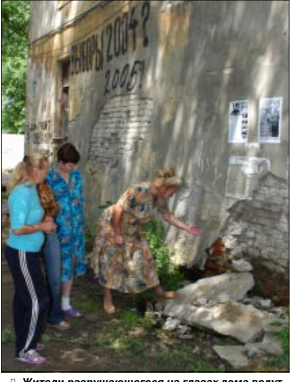
Жители разрушающегося на глазах дома ведут настенную летопись обещаний чиновников и депутатов. Появится ли надпись «Выборы-2006»?

Уникальный компьютерный центр для предприятий малого и среднего бизнеса открылся в Воронеже. Компания Intel в сотрудничестве с одной из ведущих воронежских фирм «Рет» при поддержке администрации Воронежской области создала Центр серверной компетенции.