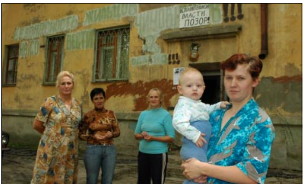
Жители дома смотрят с надеждой, которая, как известно, умирает последней.

Эти снимки наш фотокорреспондент Олег ПОЛЕХИН сделал вчера, побывав в доме по адресу: ул.Торпедо, 29.