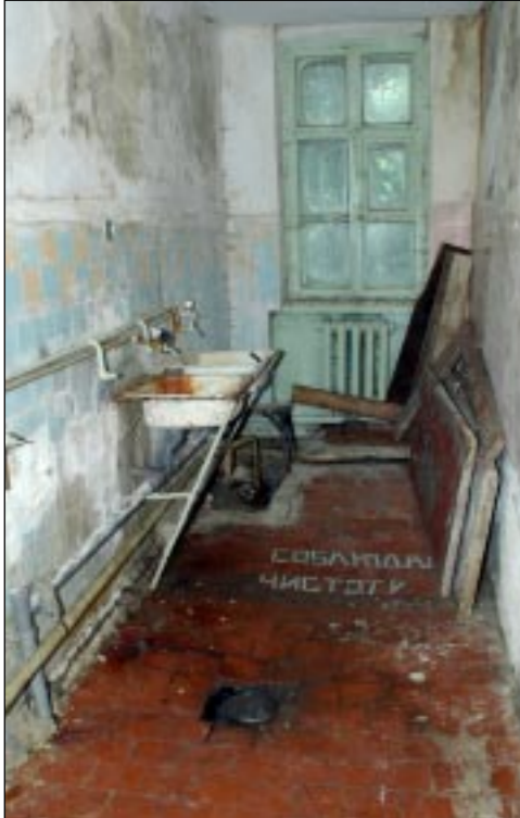
Призыв «соблюдай чистоту» здесь звучит как издевательство.