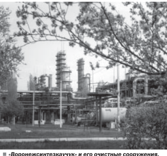
«Воронежсинтезкаучук» и его очистные сооружения.