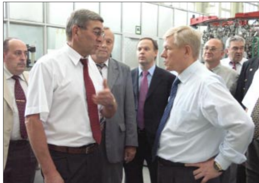
Анатолий Перминов (на переднем плане справа) знакомится с КБХА.

В Воронеже с рабочим визитом побывал глава Федерального космического агентства Анатолий Перминов. В связи с тем, что на прошлой неделе в Правительстве была принята и утверждена Федеральная космическая программа, руководство рассмотрело и определило объемы работ воронежских предприятий, которые работают в ее рамках.