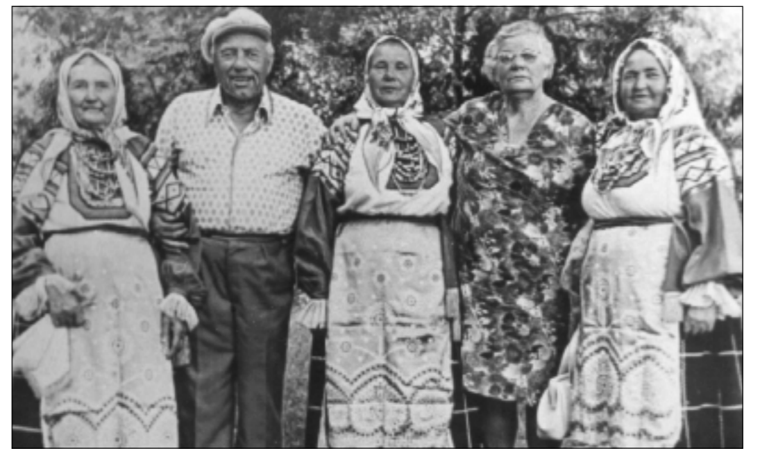
Композитор Константин Массалитин с участниками съемок фильма «Совет да любовь».