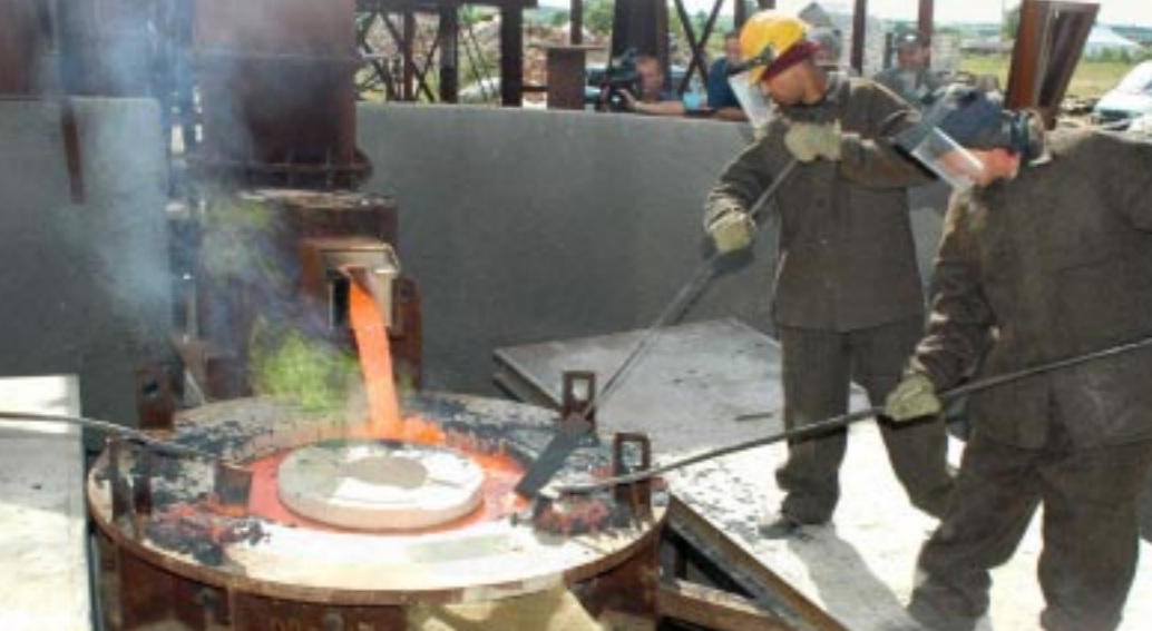
В прошедший вторник на колоколитем заводе Анисимова в Воронеже был отлит 1000-пудовый колокол для главной звонницы Спасо-Преображенского Валаамского монастыря.

Самый большой колокол Валаамской обители, созданный когда-то в память о святом апостоле Андрее Первозванном, сам носивший имя «Андрей», оброшенный с колокольной в годы советской власти и гнивший в водах Ладожского озера, должен вновь зазвучать после 66 лет молчания.