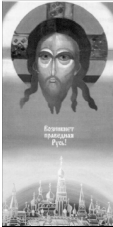
Плакат Елены КУРМАНОВСКОЙ.