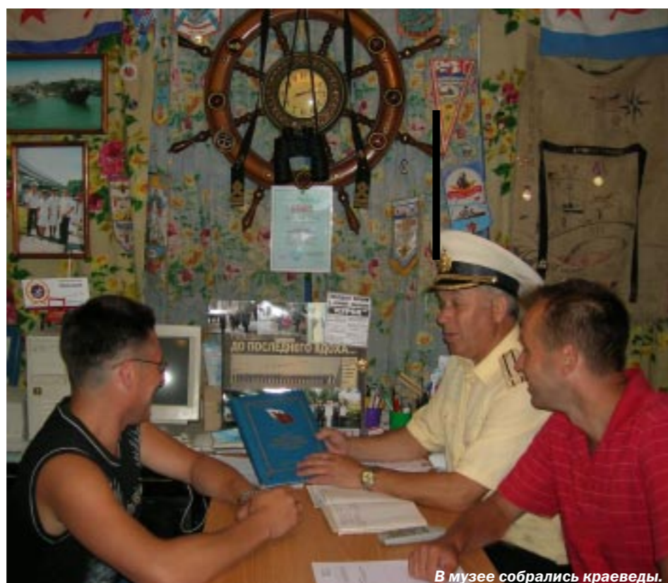
В музее собрались краеведы.

Единственный в Воронеже общественный музей истории русского флота пришёл к своему пятилетию. Накануне Дня Военно-морского флота сюда и наградили ребята, отдыхавшие в лагере центра социального обслуживания населения «Радуга».