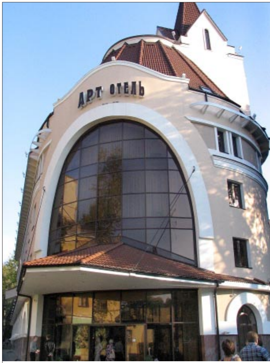
В центре Воронежа, на улице Дзержинского, открылся отель бизнес-класса. Присутствовавший на торжественной части губернатор Владимир Кулаков сказал, что отель такого уровня — это первый, и очень удачный, шаг в развитии гостиничного бизнеса в Воронеже. К тому же он может привлечь необходимое внимание иностранных инвесторов.