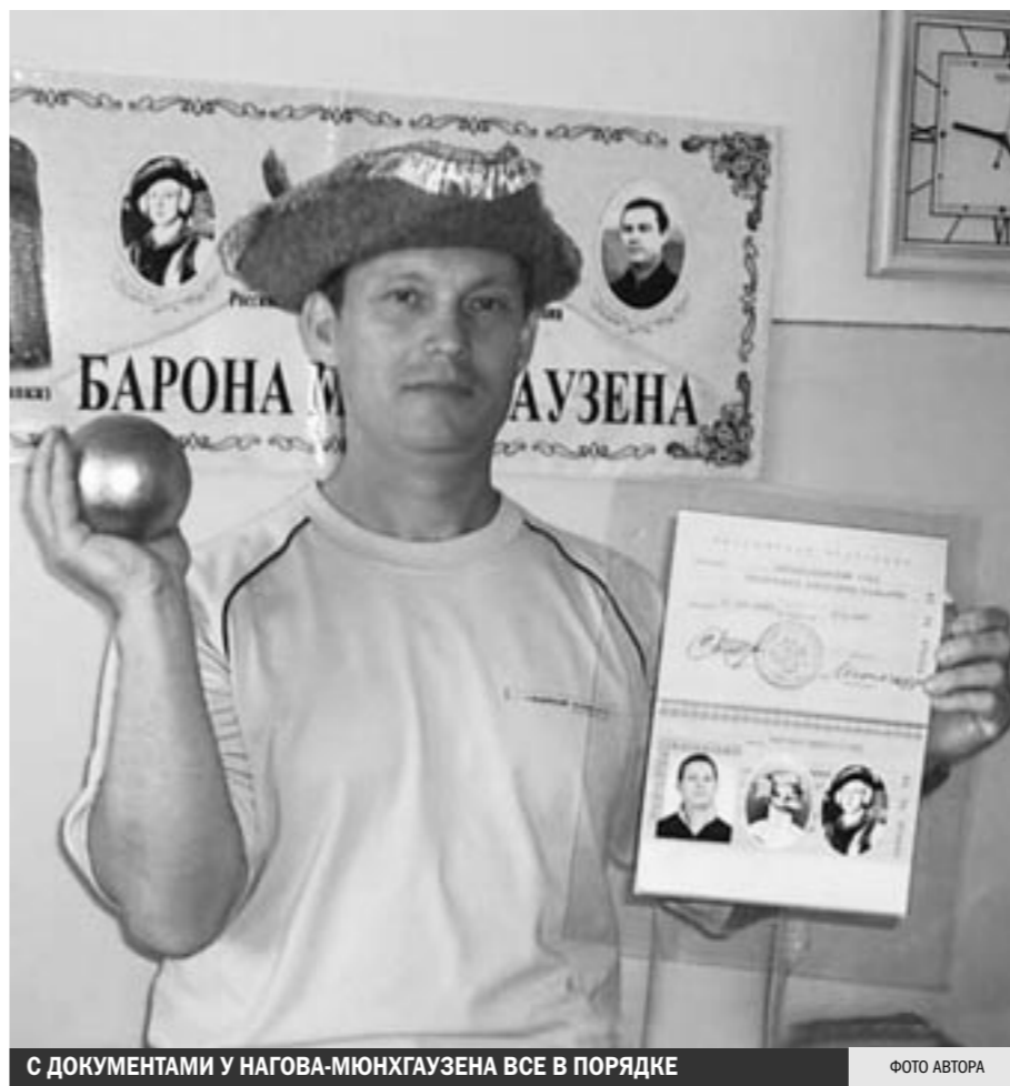
С ДОКУМЕНТАМИ У НАГОВА-МЮНХГАУЗЕНА ВСЕ В ПОРЯДКЕ

не. У всех сложился определенный героический образ, совершить что-то подобное полету на ядре в наше время просто немислимо, а чтобы образу соответствовать, надо делать что-то близкое с ним соотносящееся. Тогда ты можешь чувствовать себя человеком, достойным имени предка. Как известно, история отдыхает на своих потомках, а формально считается потомком — это не по мне.