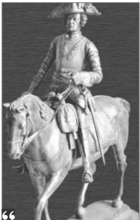
Россия сейчас на подъеме патриотизма и остро нуждается в собственном национальном символе. Им станет по праву барон Мюнхгаузен — офицер Русской армии

— По той простой причине, что это слишком известная фигура, в первую очередь, конечно, в литературном пла-