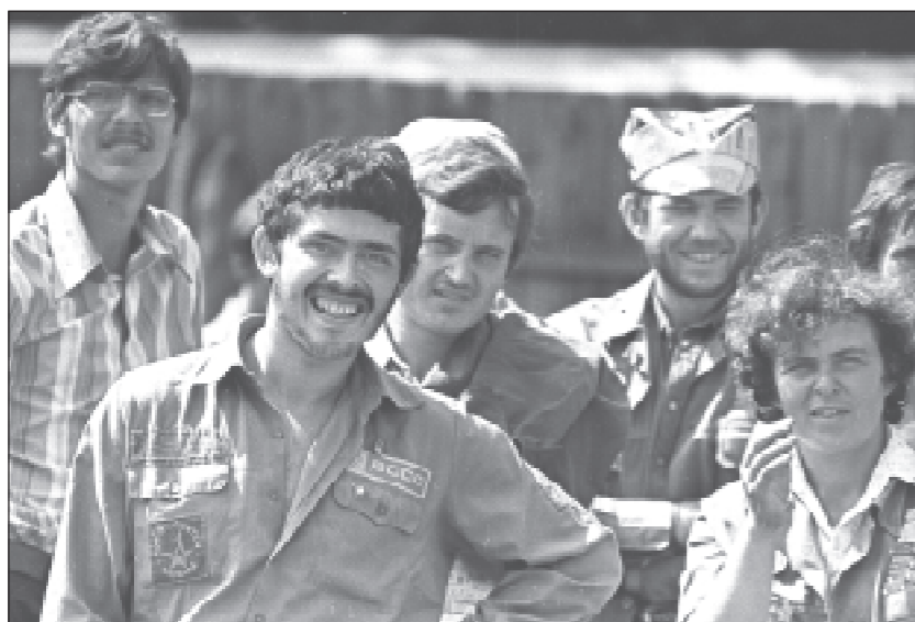
Стройотряд восьмидесятых годов.

Те, кому довелось быть студентом во времена Советского Союза, помнят, какое огромное значение придавалось тогда работе вузовских стройотрядов. Начавшие возникать после войны, изначально они собирали комсомольцев-энтузиастов, мечтавших помочь стране преодолеть разруху. Со временем идея трансформировалась: к середине 60-х стройотряды стали гораздо более массовым явлением.