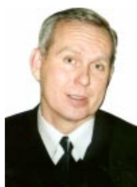
Главное управление образования Воронежской области, совет директоров учреждений начального профессионального образования, педагогический коллектив профессионального училища №53 г. Воронежа.