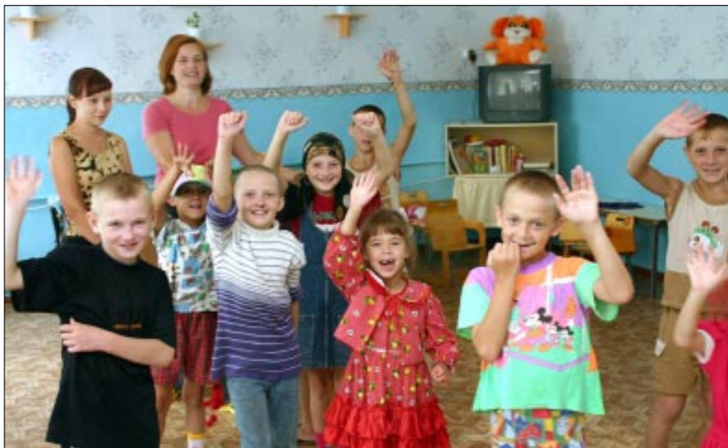
Ребята из реабилитационного центра.