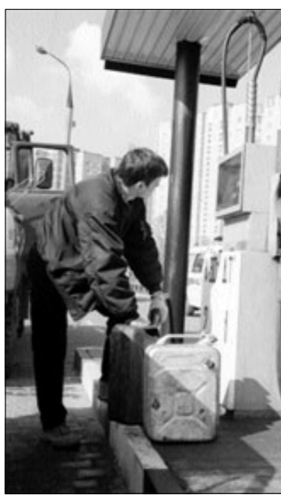
Наши люди всегда готовы к росту цен.