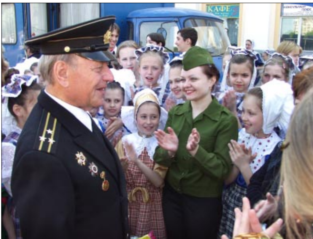
Встреча с ветеранами.

Владимир ЕВТУШЕНКО, пресс-центр областного совета ветеранов войны и труда.