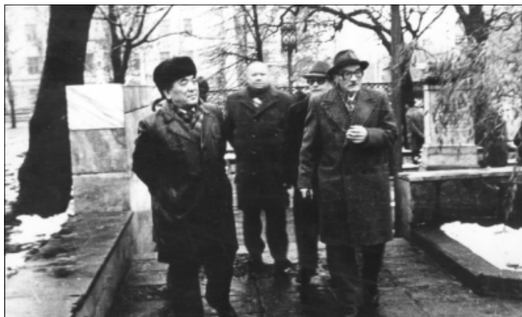
Известный советский поэт Давид Кугультников (слева) и прозаик Гаврил Троепольский на Кольцовско-Никитинских днях. 1973 год.