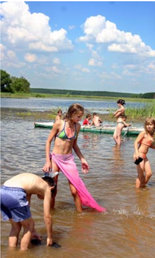
Ребятам из лагеря «Ракета» с погодой повезло.