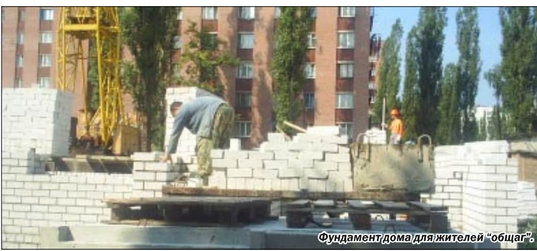
Фундамент дома для жителей «общаг».