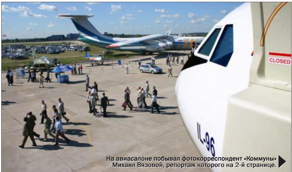
На авиасалоне побывал фотокорреспондент «Коммуны» Михаил Вязовой, репортаж которого на 2-й странице.

но-космического комплекса, а с другой стороны - продемонстрировал открытость нашей промышленности для совместных проектов с зарубежными партнерами. МАКС - это своего рода визитная карточка великой авиационной державы, статус которой Россия намерена удерживать и укреплять.