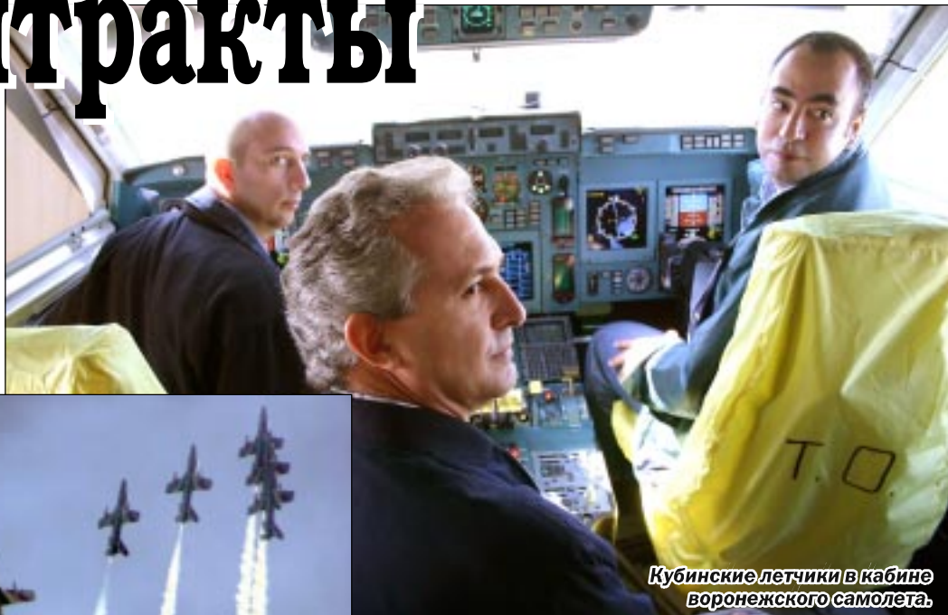
Кубинские летчики в кабине воронежского самолета.