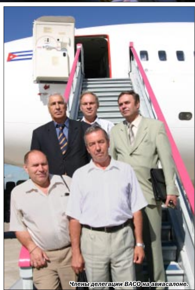
Члены делегации ВАСО на авиасалоне.

В деловой части Московского авиационного салона ОАО «Ильюшин Финанс Ко» заключило семь соглашений общим объемом более 1,6 миллиарда долларов США, из них около 1 миллиарда – заказы для ОАО «Воронежское акционерное самолетостроительное общество» (ВАСО).