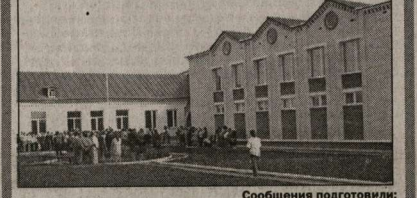
Сообщения подготовили: Сергей КРОЙЧИК, Петр ЧАЛЬИЙ, Ирина ШАБАНОВА.

Воробьевские этажи Новосельями отмечен сентябрь в Воробьевском районе. Ребята из Первоинкольского учатся теперь в новом школьном здании (на фото), в котором просторные классы и кабинеты, удобный спортивный зал. А в селе Затон открыта рабочая амбулатория. Такими же учреждениями теперь обеспечено все население глубинки.