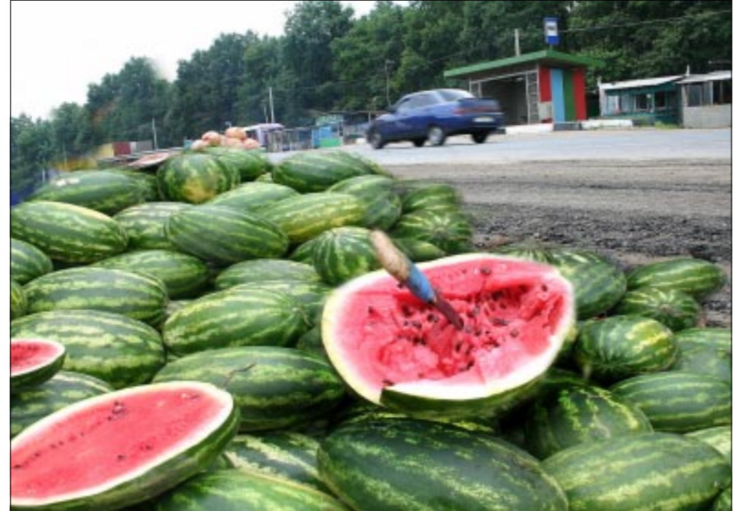
Коллектив Евгения ЛЕЩИНКА

данных птиц, убитых в результате санитарных мероприятий, лежат на земле, а торговля идет безо всяких разрешительных документов. Это происходит в закрытых птицеводческих хозяйствах.