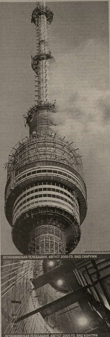
ОСТАНКИНСКАЯ ТЕЛЕБАШНЯ. АВГУСТ 2000-ГО. ВИД СНАРУЖИ

Предполагаю, что когда Ходорковский почувствует растущий спрос в стране не на социал-демократию, а на национал-социализм, следующим его шагом станет переход в стан националистов. Но есть одна проблема. Для очередной реинкарнации всему нашему «птичнику» фирмы Феникс потребуется разрешение от Вашингтонских хозяев.