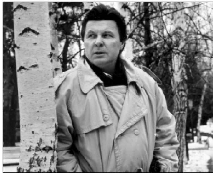
Певец Лев Лещенко, Воронеж, 1974 год.