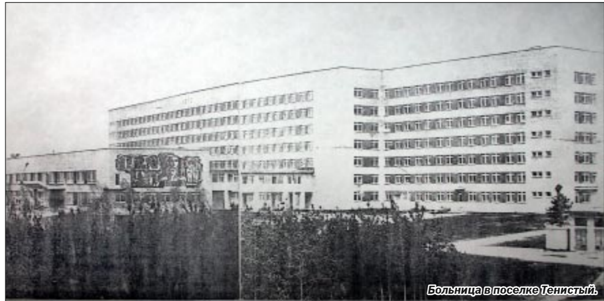
Больница в поселке Тенистый.