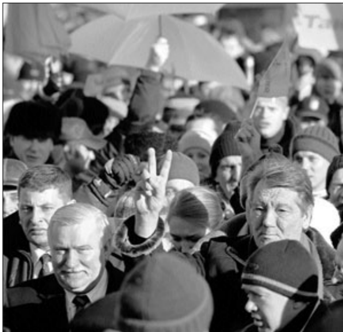
Бывший лидер «Солидарности» Лех Валенса и Виктор Ющенко на митинге в центре Киева.

Между тем вопрос западного «спекура» не был провокационным выдумкой. Теперь-то, из воспоминаний советских генералов, известно, что в Москве серьёзно обсуждался вариант ввода наших войск в Польшу. Но даже непримиримому марксисту и ста-