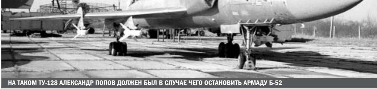
НА ТАКОМ ТУ-128 АЛЕКСАНДР ПОПОВ ДОЛЖЕН БЫЛ В СЛУЧАЕ ЧЕГО ОСТАНОВИТЬ АРМАДУ Б-52

И не только без крыльев. Они умели гонять в небе воздушных шпионов, но были беспомощными на земле. Десять лет после ис-