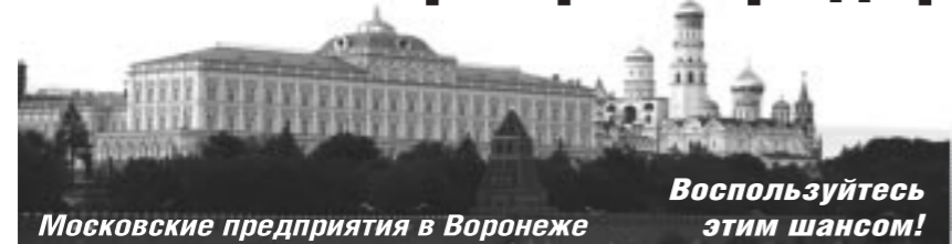
Московские предприятия в Воронеже