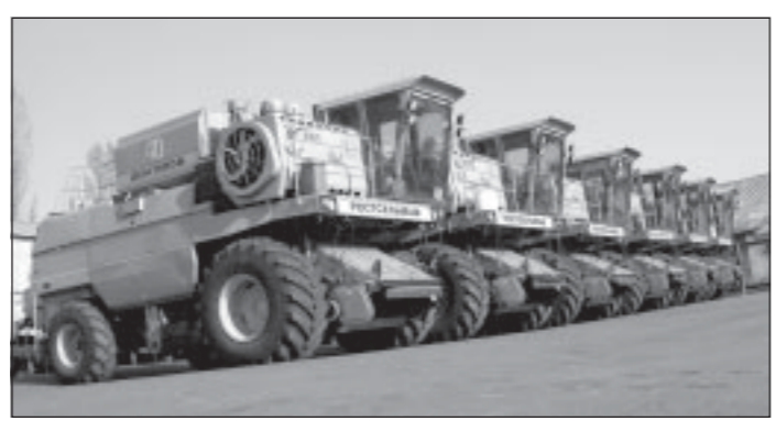
Идет техника на село.

На заседании комитета по промышленности, транспорту, связи под председательством Николая ПОСЛУХАЕВА были подведены промежуточные итоги реализации Программы экономического и социального развития Воронежской области на 2002-2006 годы и 1 полугодие 2005 года. Программа, основная цель которой является создание условий для последовательного повышения уровня и качества жизни населения, дала мощный импульс развитию реального сектора экономики и перспективных экономических направлений, что позволило значительно увеличить доходную часть бюджета области.