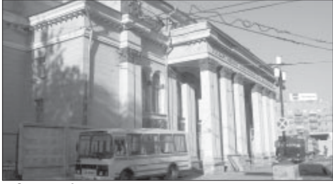
Открыто финансирование реставрации старого здания Воронежского драмтеатра им. А.В.Кольцова.