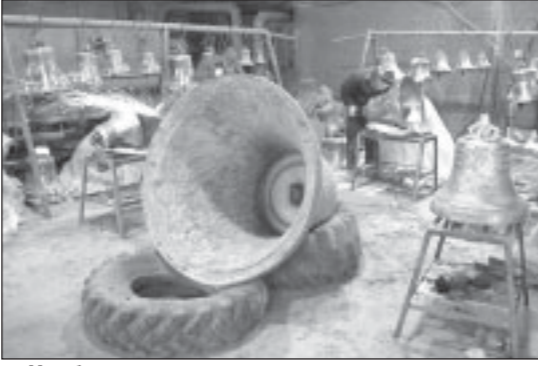
Чтобы пели колокола.