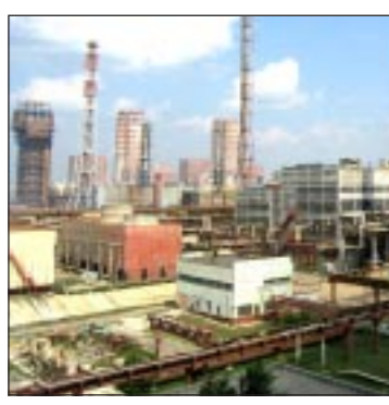
Гигант «Минудобрения» тоже получит господдержку.