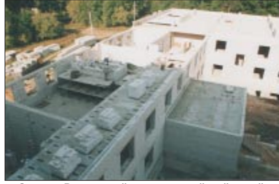
Здание Рамонской центральной районной больницы. Срок сдачи - 2006 год.