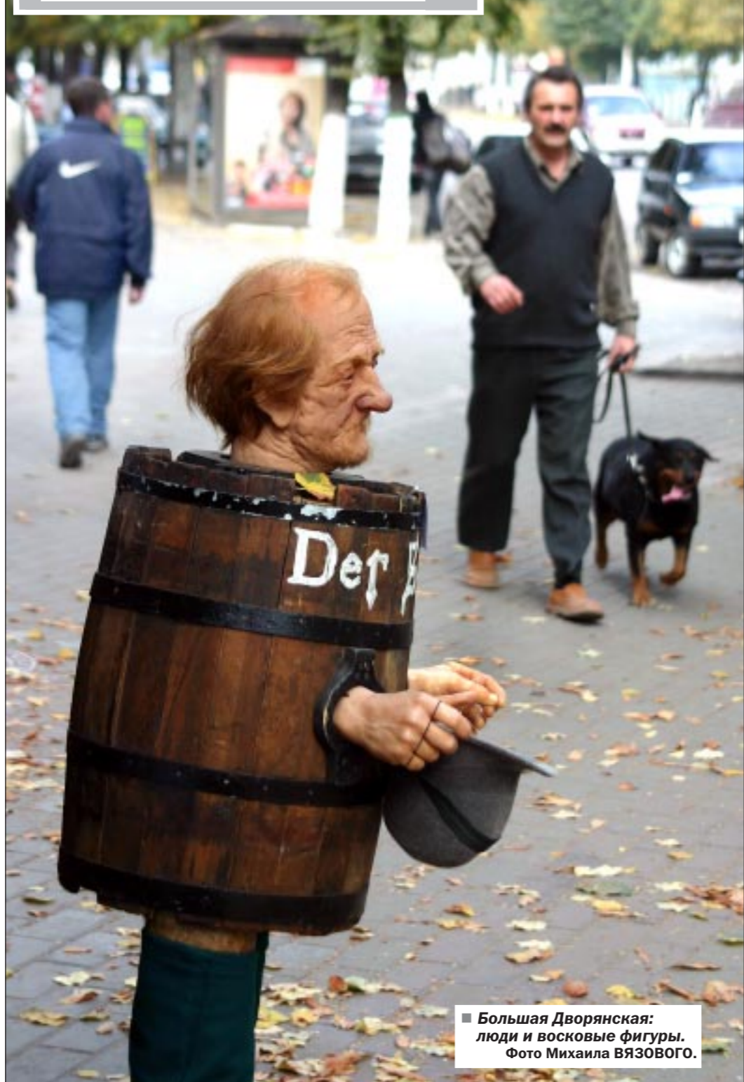
■ Большая Дворянская: люди и восковые фигуры.