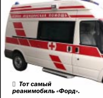
Тот самый реанимобиль «Форд».