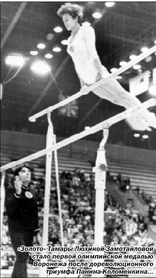
«Золото» Тамары Лухиной-Замотайловой стало первой олимпийской медалью Воронежца после дореволуционного триумфа Панина-Коломенкина...

И все же воронежские гимнастические школы отмечают свой праздник с надеждой на лучшее и в полном соответствии с богатыми традициями. После того, как школа имени