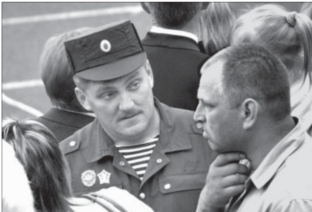
Несмотря на праздничный день, и сегодня сотни сотрудников воронежской милиции находятся на боевом посту, охраняют законность, достоинство, безопасность и жизнь граждан, обеспечивают спокойствие и порядок на наших магистралях, в городах и селах, готовы по первому зову оказать помощь каждому человеку.

Мы особо гордимся тем, что депутатами Воронежской областной Думы являются Герои России Александр Пономарев и Юрий Анохин.