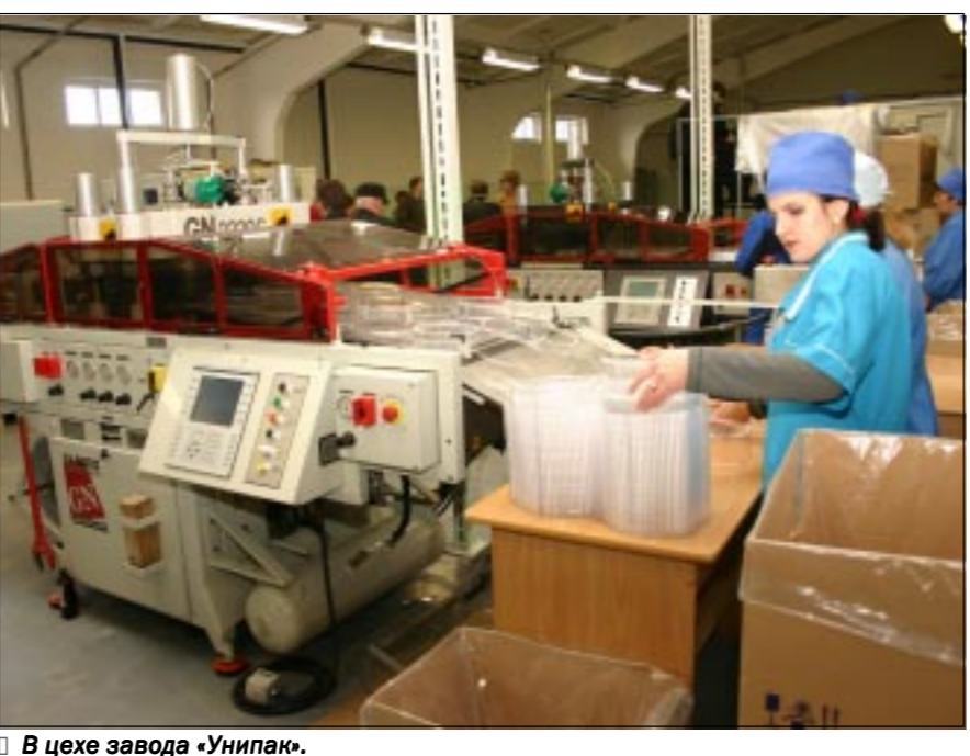
В цехе завода «Унипак».