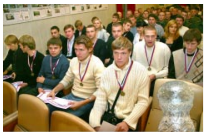
Накануне Дня милиции состоялось чествование футболистов воронежского «Динамо», ставшего победителем первенства Межрегиональной общественной ассоциации «Черноземье».

Подчеркну, что победа дает команде право, владеть за лискинским «Локомотивом», представлять наш город во втором дивизионе первенства России.