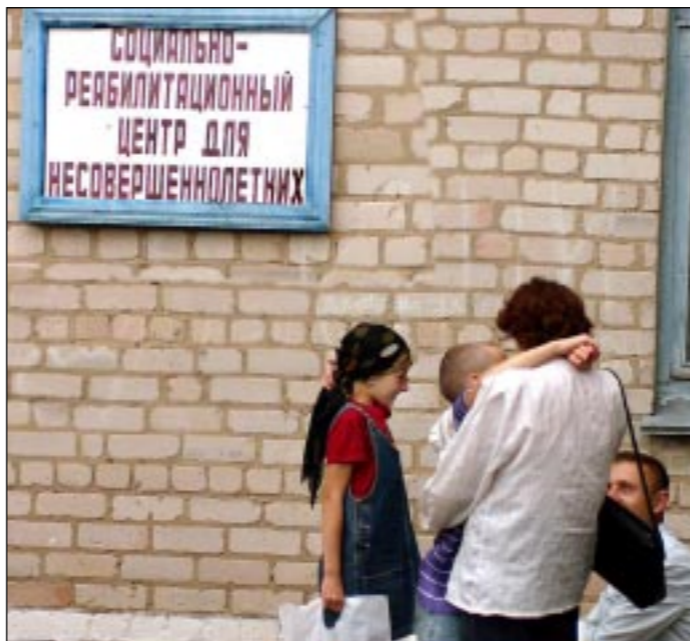
Эти ребята из неблагополучных семей находят душевное тепло и уют в Мировском детском доме Панинского района.