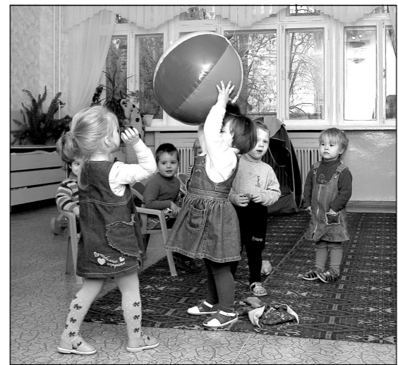
После качественного ремонта в детских садах уютно, как дома.