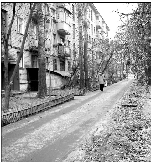
Еще весной здесь было ни пройти ни проехать...