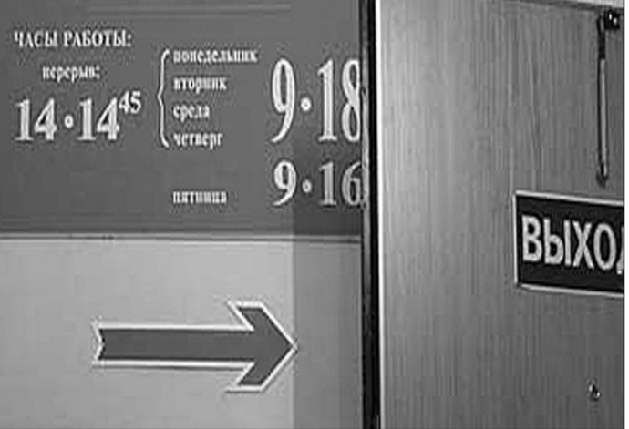
Чтобы люди не уходили разочарованными.