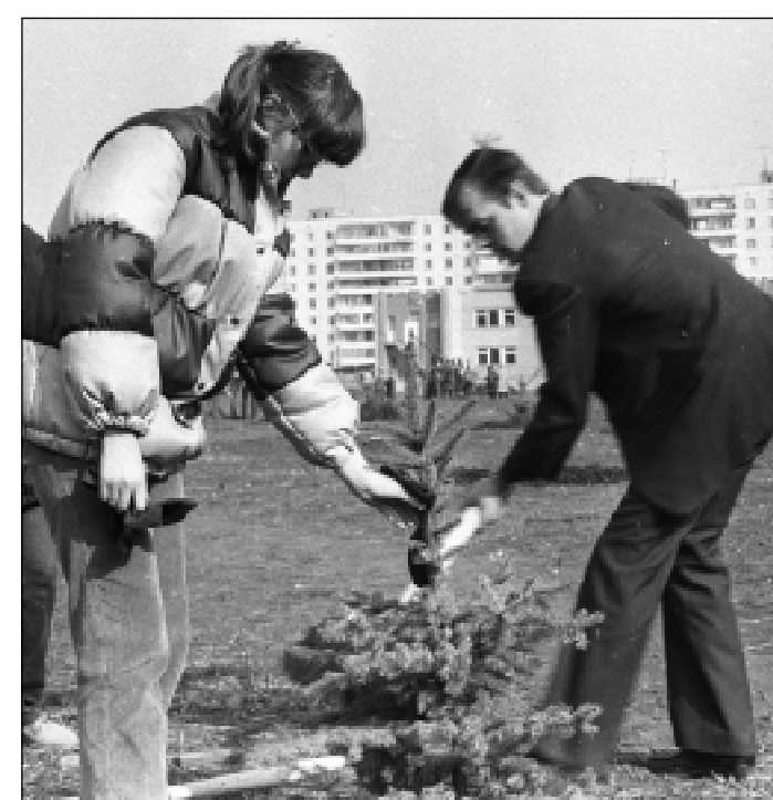
Сажали с энтузиазмом...