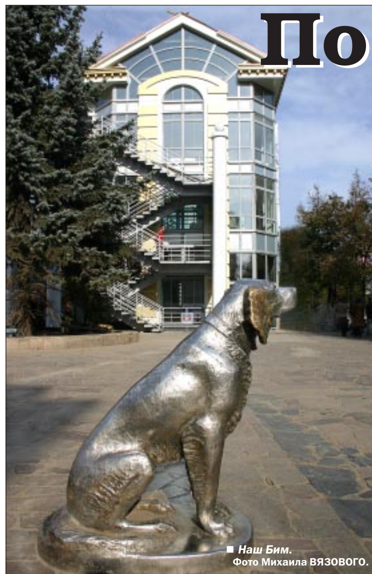
Наш Бим.