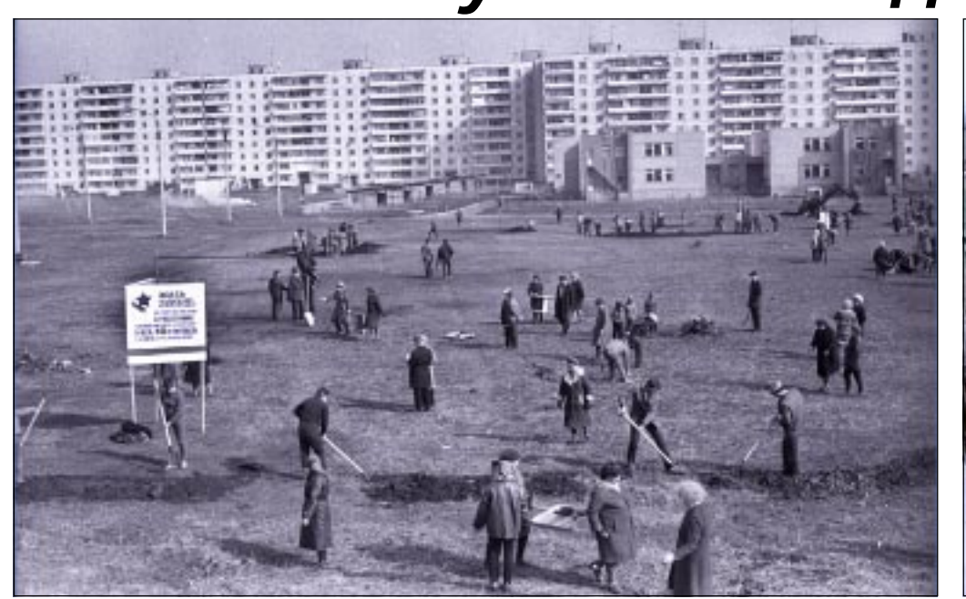
Двадцать лет назад, тоже с благой целью – акkurat к 40-летию Победы - на этом месте, в Северном микрорайоне собирались разбить парк, и даже успели насадить деревья. Сейчас здесь выросли... многоэтажки. Снимки, которые разделяют 20 лет, сделал Михаил Вязовой.