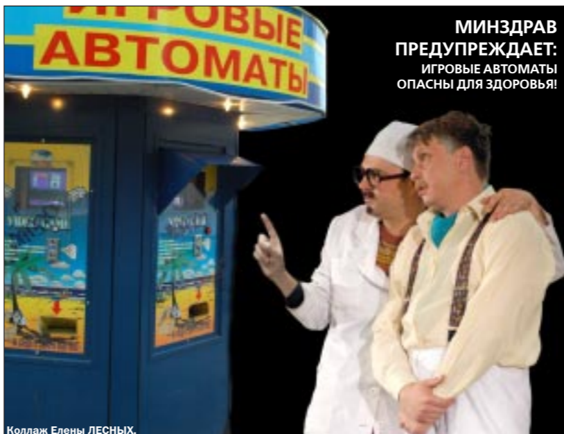
Коллаж Елены ЛЕСНЫХ.

Медицинская составляющая игромании, — говорит Прудников, — это зависимость (по — научному аддикция). Аддикт — это человек, пристрастный к рабству за долги. Долги аддикт делает во время игры, так как постоянно стремится отыграться, испытывая тягчайший груз вины. Те, кто расставляет игровые