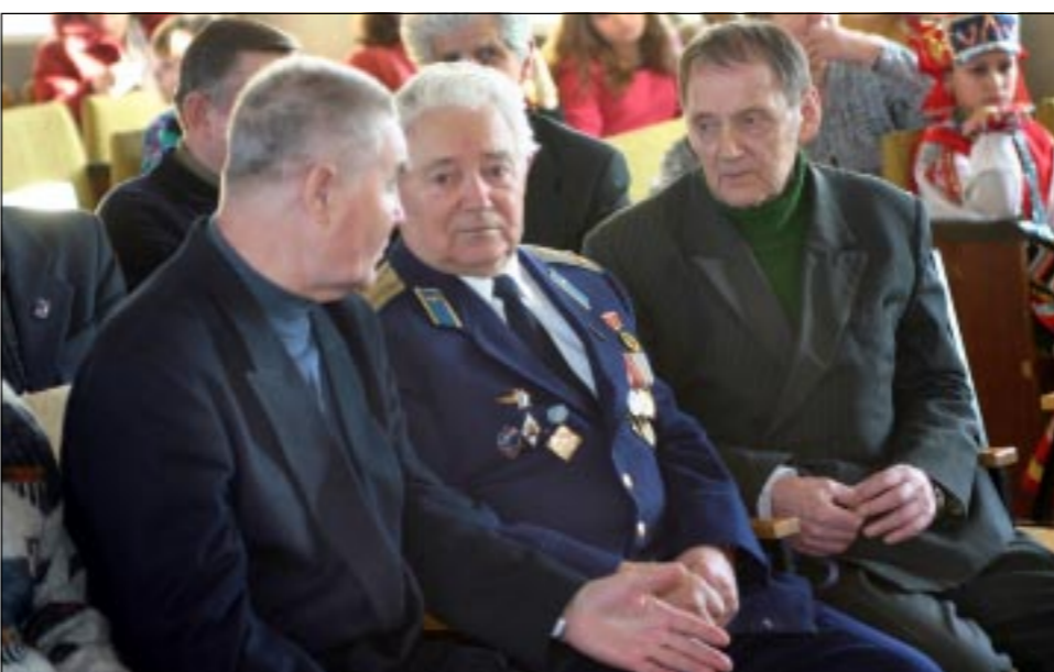
Ветераны спецшколы ВВС.

Сначала подобные встречи проходили раз в десятилетие. Затем выпускники спецшколы ВВС стали собираться чаще - через пятилетку. Нынешнее свидание с юностью прошло в 65-ю годовщину создания спецшколы ВВС.