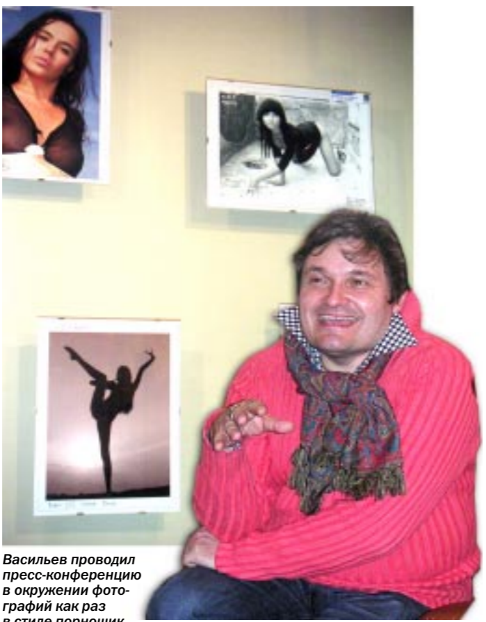
Васильев проводил пресс-конференцию в окружении фотографов.

Так определил тенденции местной моды известная фигура мировой величины в сфере моды и дизайна, историк, лектор, театральный художник и крупный коллекционер Александр Васильев. Энциклопедичность знаний, тонкий юмор, искусство воссоздавать в своих рассказах живые образы любой эпохи сделали Александра Васильева кумиром для всех, кто интересуется модой.