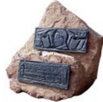
Вечению памяти о писателе посвящена экспозиция в Богучарской школе-интернате. Силами коллектива интерната в обновленном городском парке заложена шолоховская аллея. А 20 сентября открыт памятник Михаилу Александровичу в городском парке. Несмотря на холодный пронизывающий ветер, в городском парке собрались люди, которым дорого имя писателя Тихого Дона.

музеях города, встречались с людьми, знавшими прозаика, богучарскими краеведами, написали работу о писателе. А в прошлом учебном году мы участвовали во Всероссийском конкурсе проектов акции «Гражданин Воронежского края — гражданин России» с большим проектом «Михаил Шолохов на богучарской земле». При музее Богучарской школы-интерната открыто школьное экскурсионное бюро и разработан шолоховский экскурсионный маршрут районного центра, а также издан путеводитель своего рода нить Ариадны, которая поведет его обладателя по истории пребывания писателя в нашем крае. Активно сотрудничаем с Государственным музеем-заповедником автора «Тихого Дона». В течение прошлого года ее представители дважды побывали на научных конференциях в Вешенской. А в апреле 2005 года принимали гостей у себя на Великой научной конференции «Дети глазами Шолохова». Не так давно узнали мы радостную новость о присвоении школе имени Михаила Александровича. Сбылась мечта многих поколений воспитанников и педагогов Богучарской школы-интерната и творческий талант писателя будут привлекать к себе все новые и новые поколения учащихся школы-интерната. В этом силе Шолохова.