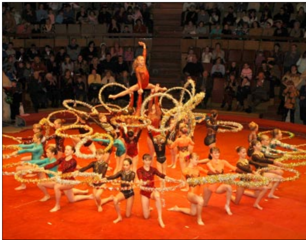
Воронежская школа акробатики и прыжков на батуте по традиции встретила Новый год отчетным представлением в цирке. И, как всегда, собрала аншлаги.