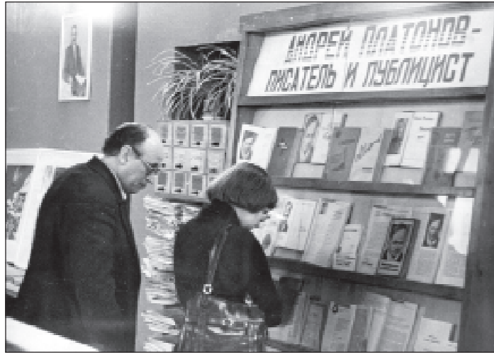
Выставка, посвященная 80-летию Андрея Платонова.