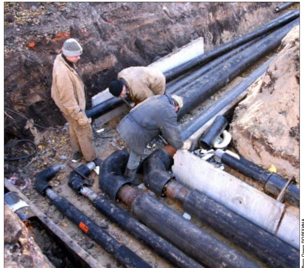
Реформа ЖКХ: дело – труба?