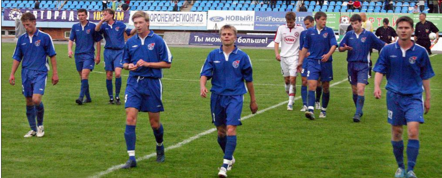
«Факел» уходит с поля. Или из большого футбола?

Отсутствие планомерной программы подготовки резерва в клубе, отсутствие работы со стороны клуба с детскими тренерами города, в конце концов, отсутствие футбольной академии в городе заставляют юных футболистов и их родителей искать