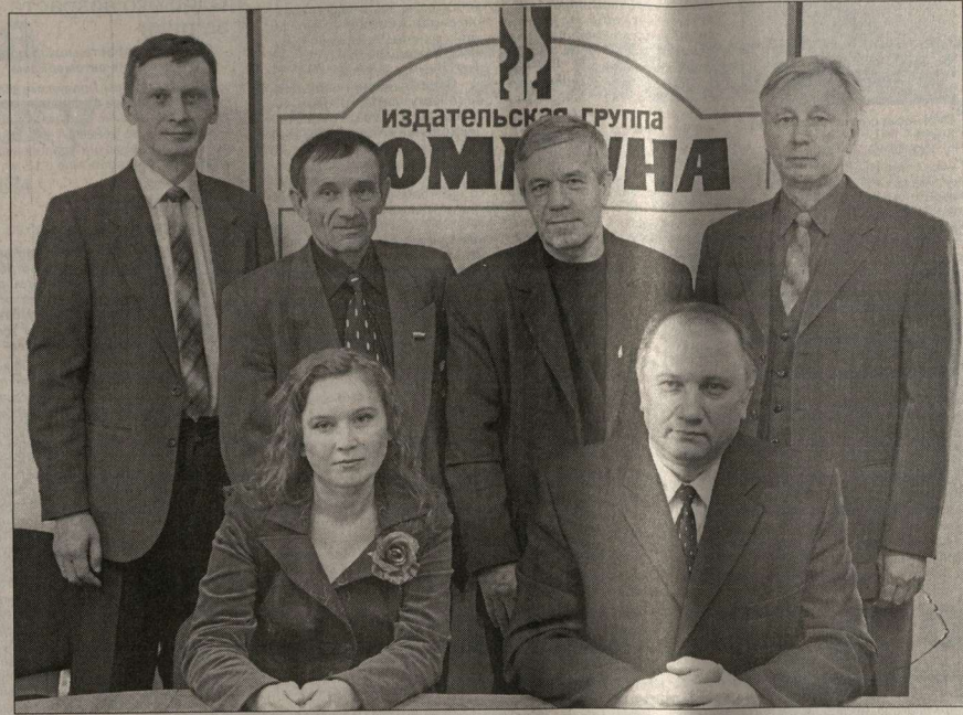
Журналисты и авторы «Коммуны» - победители областных конкурсов.

Уважаемые жители Воронежской области! День российской печати по праву можно назвать всенародным праздником. Сегодня средства массовой информации стали неотъемлемой частью человеческого бытия, без которой невозможно представить свою причастность к современному цивилизованному миру. В народе давно подмечено: «Что написано пером, то не вышибить топором». В этой пословице отражена сила печатного слова. Доброе или критическое – оно поднимает дух, ведет к действию, служит делу просвещения, идеям гуманизма. Сегодня серьезными конкурентами перу стали радио и телевидение. Они четко и оперативно реагируют на повседневную жизнь, нередко делая нас непосредственными участниками событий. А когда представляешь себе всю громаду информационного потока, которая накатывается ежедневно на города и села нашей области, с чувством восхищения и уважения думаешь о журналистах, полиграфистах, распространителях печати. Именно по крупницам собирают информацию, несут ее в эфир, в редакцию и типографию, чтобы отдать людям доброту своего таланта, энергию творчества и создания. Вместе с многотысячной армией читателей, слушателей и зрителей от всей души сердечно поздравляю журналистов всех поколений, всех, кто трудится в сфере СМИ, с профессиональным праздником. Желаю труженикам пера и микрофона, издателей, полиграфистам и распространителям периодических творческих успехов, доброго здоровья и семейного благополучия. Глава администрации Воронежской области В.К.КУЛКОВ