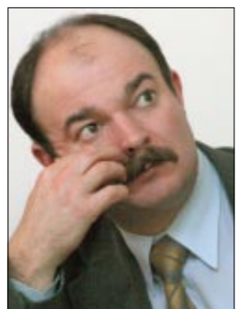
СМИ носит социальный характер?