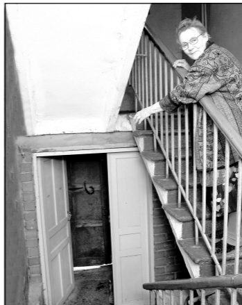
Подъезд начинается с дверей.