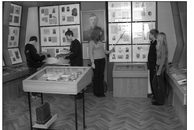
В музее школы №36 все как в музее.