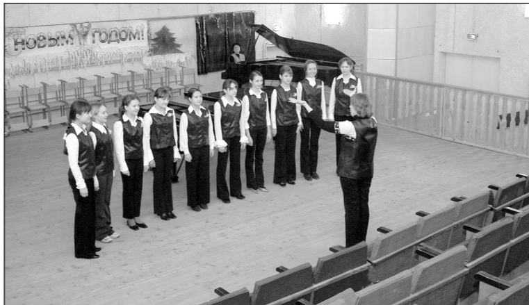
Заново отделан актовый зал в школе искусств №5.

Словом, для того, чтобы не утонуть в море житейских проблем, каждому депутату надо иметь четкую систему взаимоотношений с населением округа. В этом убеждает практика работы с избирателями, и этому принципу я буду следовать в дальнейшем.