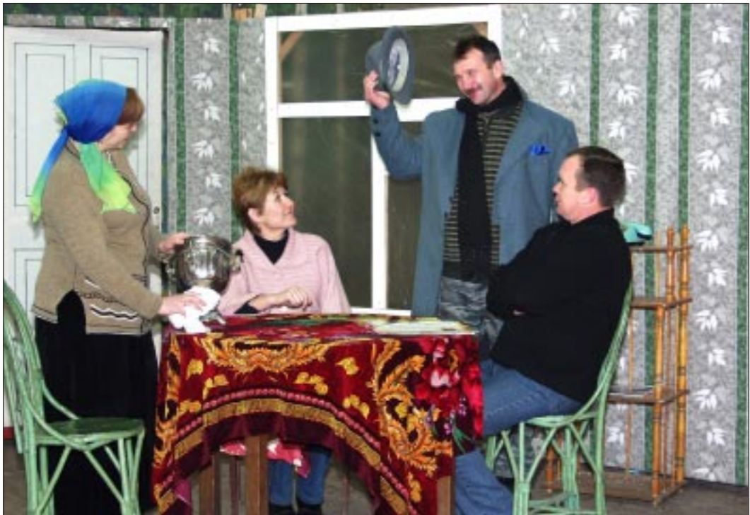
В Доме культуры - репетиция нового спектакля.

Алексей СОЛОВЬЕВ. Аннинский район. Фото автора.