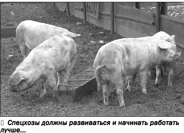
Спецхозы должны развиваться и начинать работать лучше...