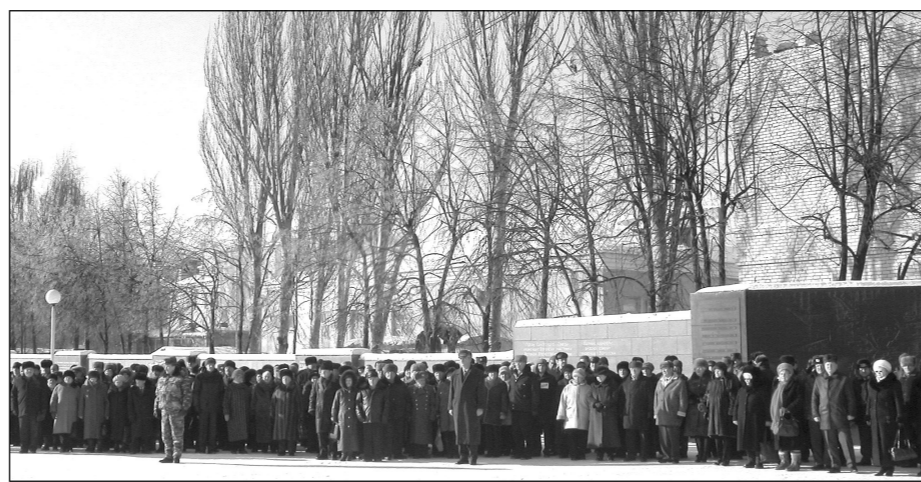
На площади Победы 25 января, в День освобождения Воронежа от немецко-фашистских захватчиков.