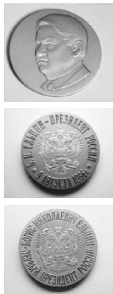
Слева направо: лицевые стороны медалей из платины и золота одинаковые, а обратные — разные.

31 декабря 1999 года — делает новогодний подарок российскому народу: неожиданно объявляет о своей отставке и передает бразды правления Владимиру Путину.