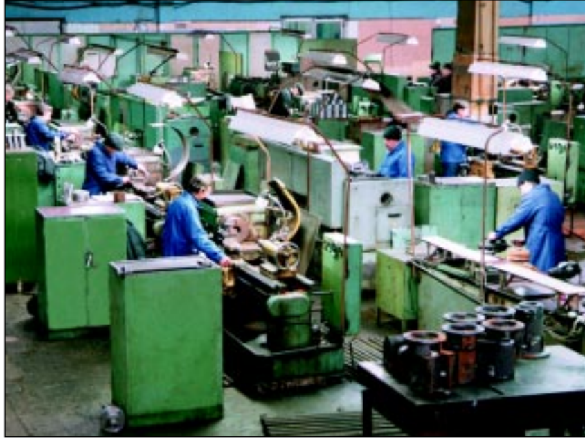
Завод Гидрогаз образован в 1996 г. Является одним из крупнейших предприятий страны по выпуску насосного оборудования и запорно-регулирующей арматуры для особо-агрессивных химических и взрывоопасных сред, а также комплексов очистки жидкостей с использованием мембранных технологий. Численность работников 700 человек.

Особая наша забота - инновационная политика. Завод Гидрогаз, участвуя в программе экономического и социального развития Воронежской области, за последние годы осуществил 8 инновационных проектов по разработке и освоению серийного производства новой техники, получившие в 2005 году две медали Международного салона инноваций и инвестиций в Москве. Продукция завода является лауреатом конкурса «100 лучших товаров России», награждена дипломами ряда международных выставок. В общей сложности, за год делается не менее 5-10 совер-