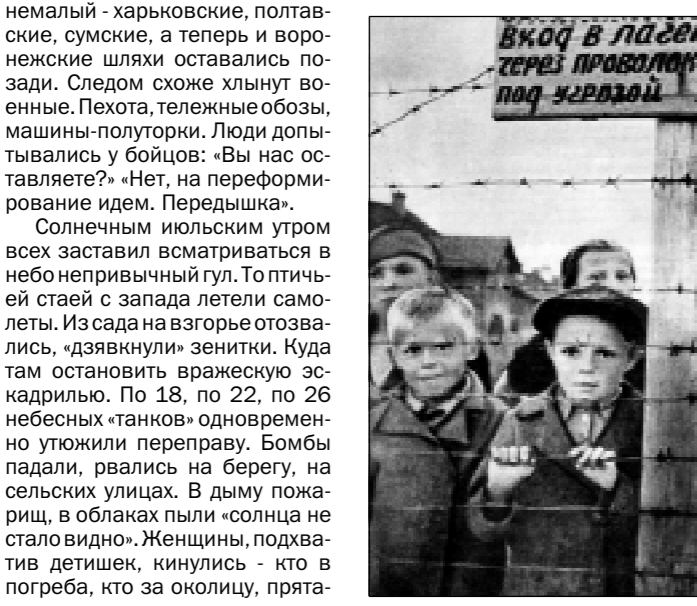
Вход в лагерь и разговор через проволоку воспринимался как угроза расстрела.

«Если мы хотим создать нашу великую Германскую империю, мы должны, прежде всего вытеснить и истребить славянские народы - русских, поляков, чехов, словаков, болгар, украинцев, белорусов», - говорил Гитлер. Что оккупанты с успехом и делали. Неисчислимы жертвы принес народы фашизм».