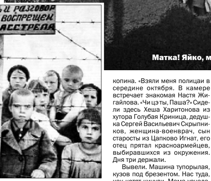
Матка! Яйко, млеко!..

«Если мы хотим создать нашу великую Германскую империю, мы должны, прежде всего вытеснить и истребить славянские народы - русских, поляков, чехов, словаков, болгар, украинцев, белорусов», - говорил Гитлер. Что оккупанты с успехом и делали. Неисчислимы жертвы принес народы фашизм».