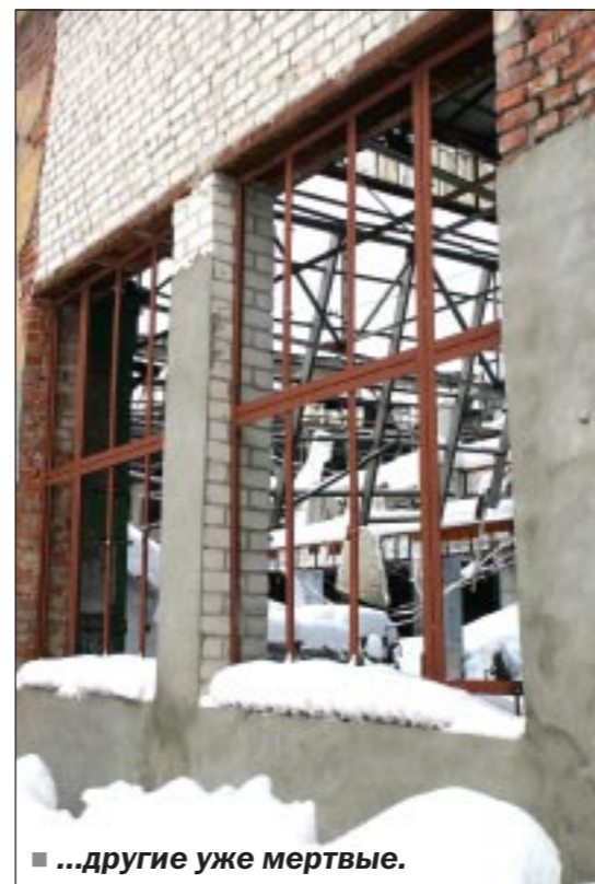
...другие уже мертвые.