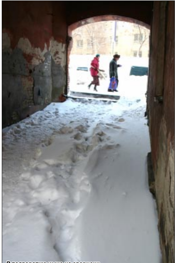
В подворотню ныне не свернешь. . .