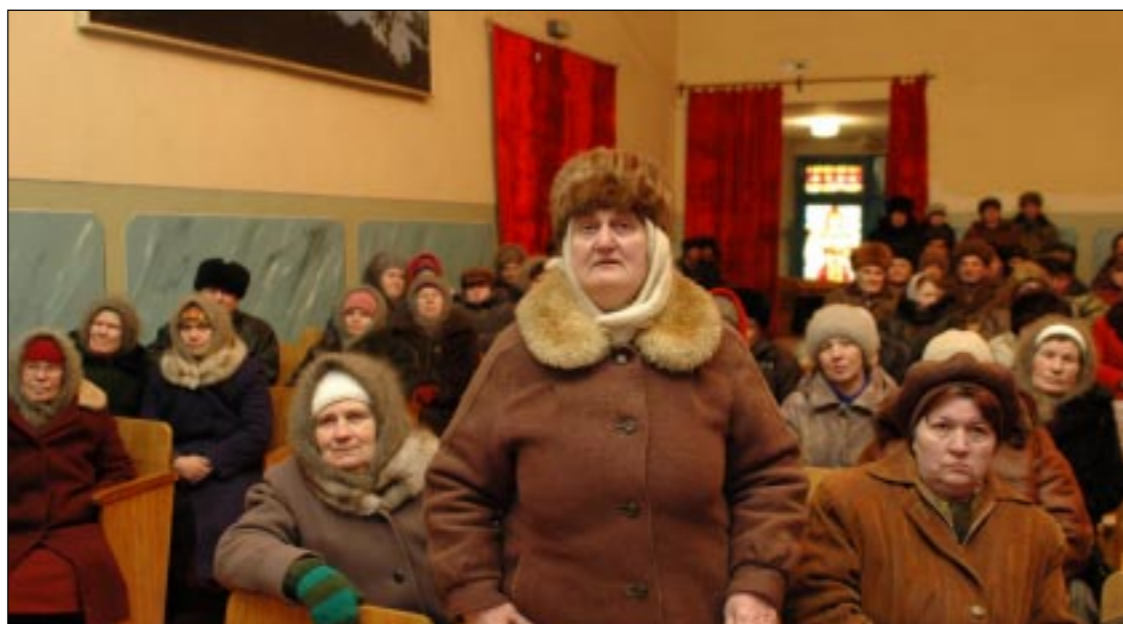
Почему «шелякинцев» подключат в последнюю очередь?