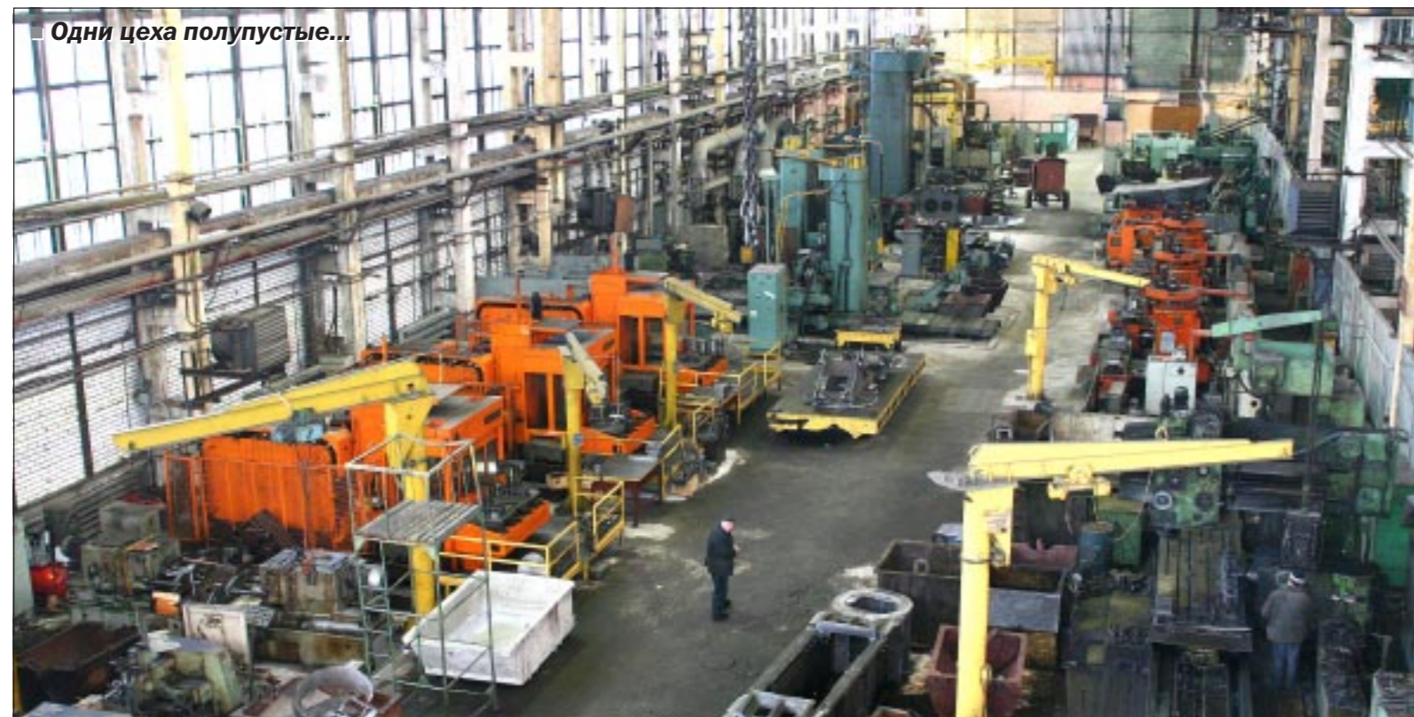
Одни цеха полупустые...