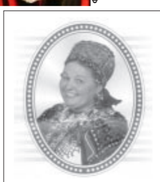
Областной фестиваль народной песни и гасушки

предстали на сцене театра оперы и балета участники фестиваля имени Марии Мордасовой