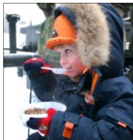
20-я гвардейская армия не только приняла участие в гонке, но и захватила с собой полевую кухню и угощала нашей всех желающих.