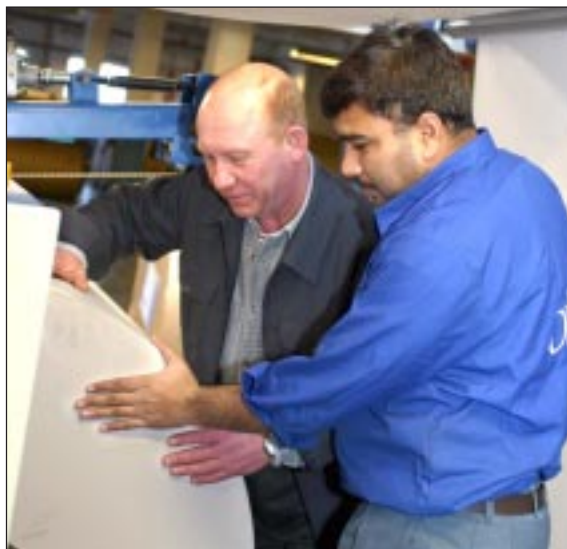
Рука об руку монтируют печатную машину индийские и воронежские специалисты.