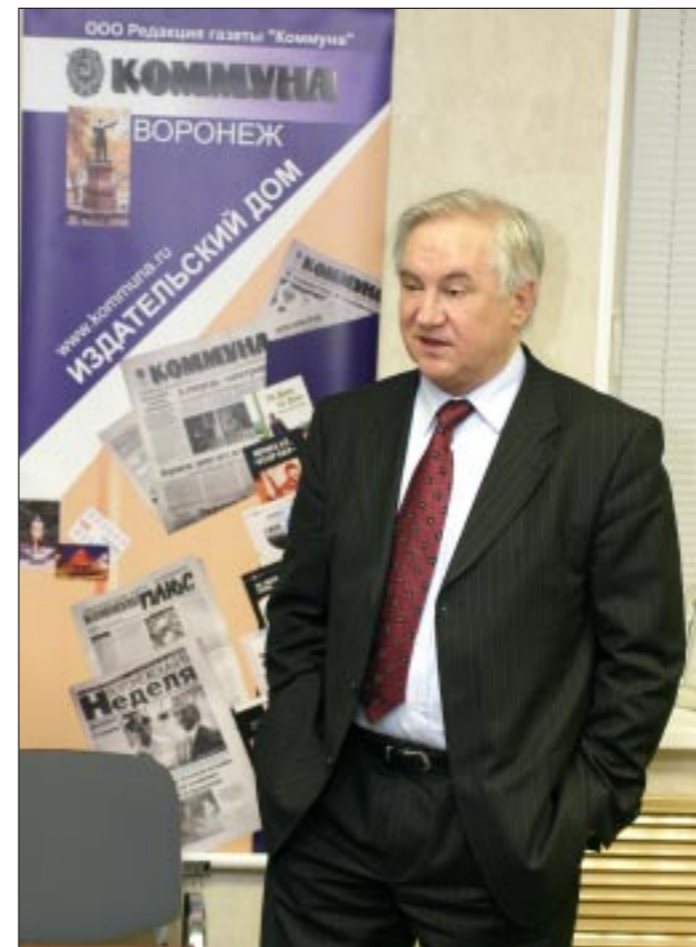
(Окончание на 2-й стр.)