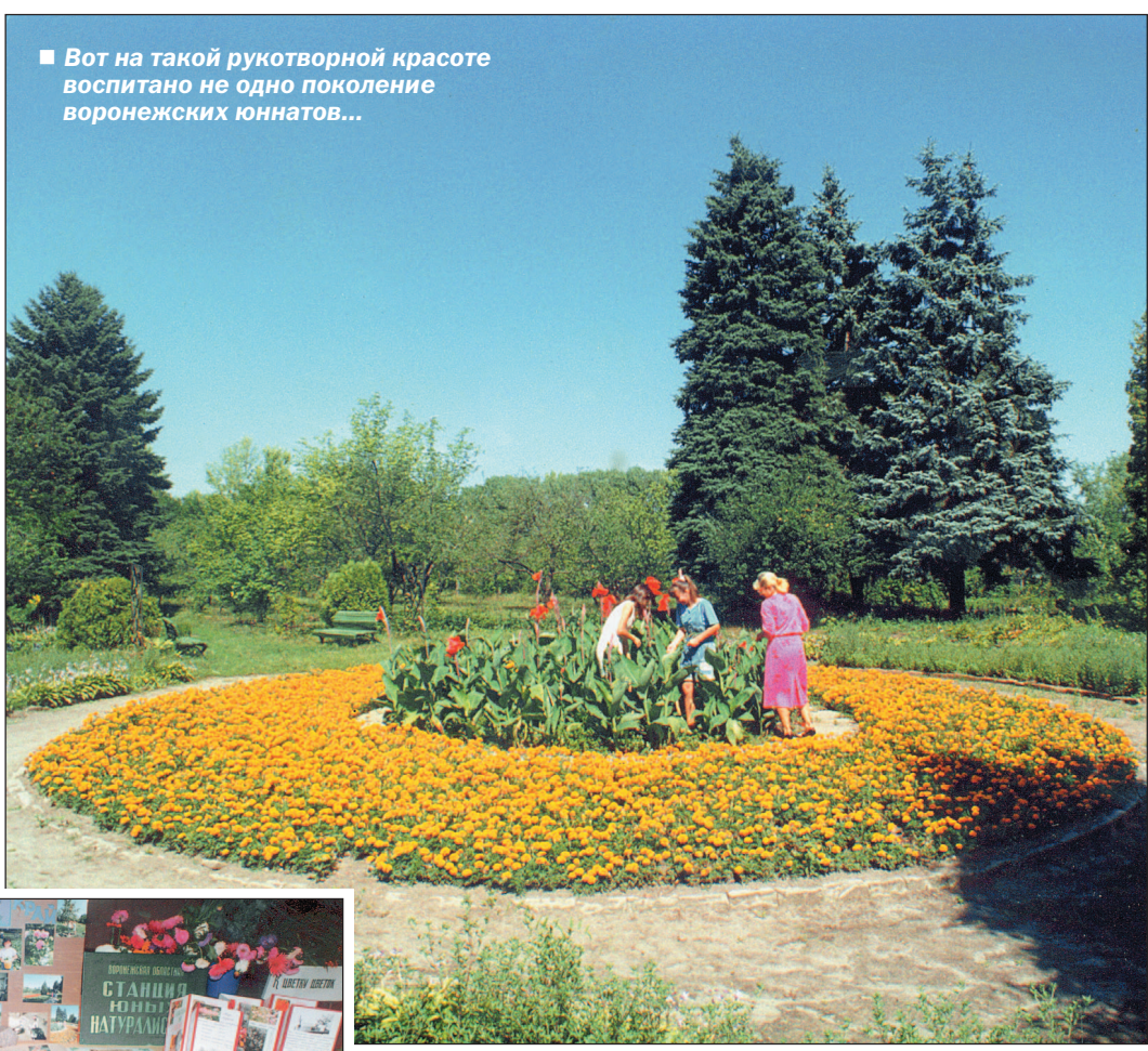
Вот на такой рукотворной красоте воспитано не одно поколение воронежских юннатов...