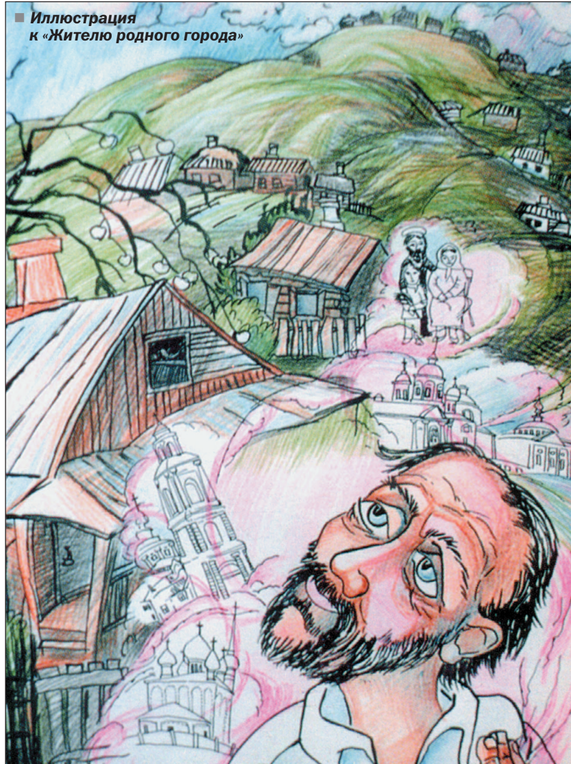
Иллюстрация к «Жителю родного города»